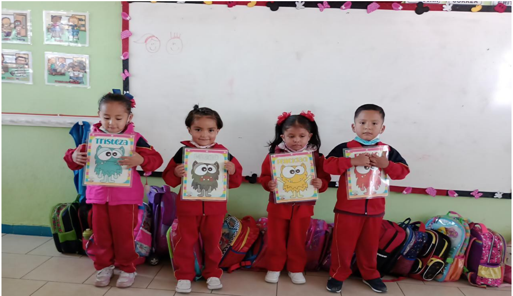
(Actividad 2: “¿Como me siento el día de hoy?”)