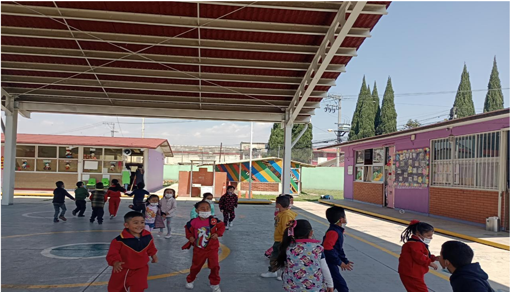
(Juego 3: “El lobo”)