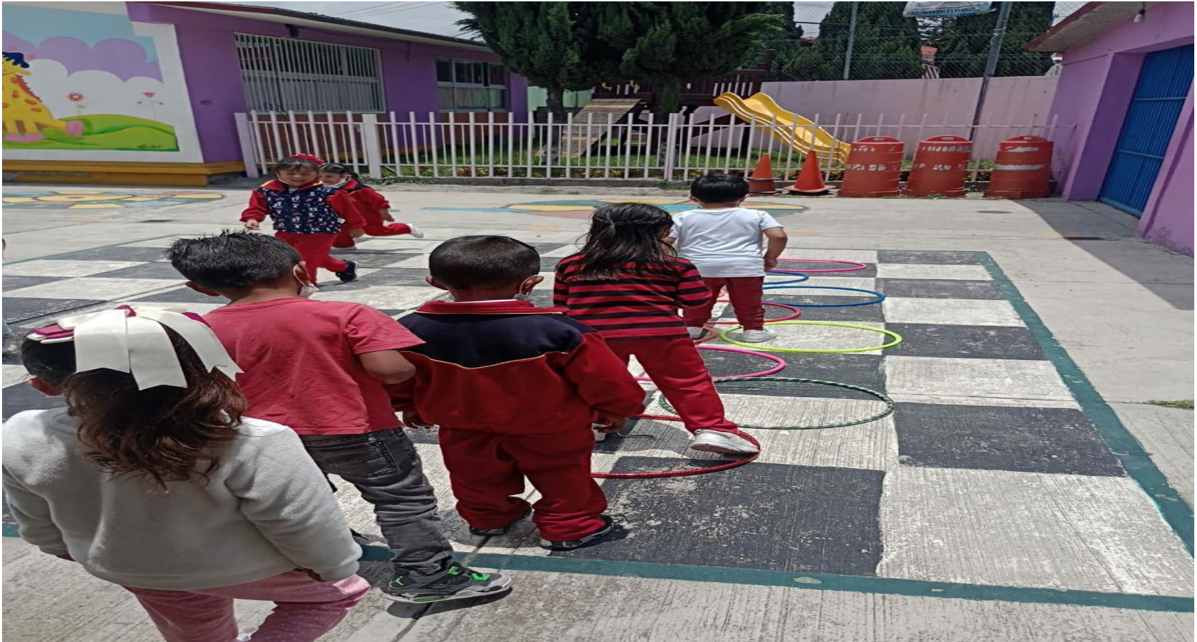
(Juego 4: "Peces y tiburones")