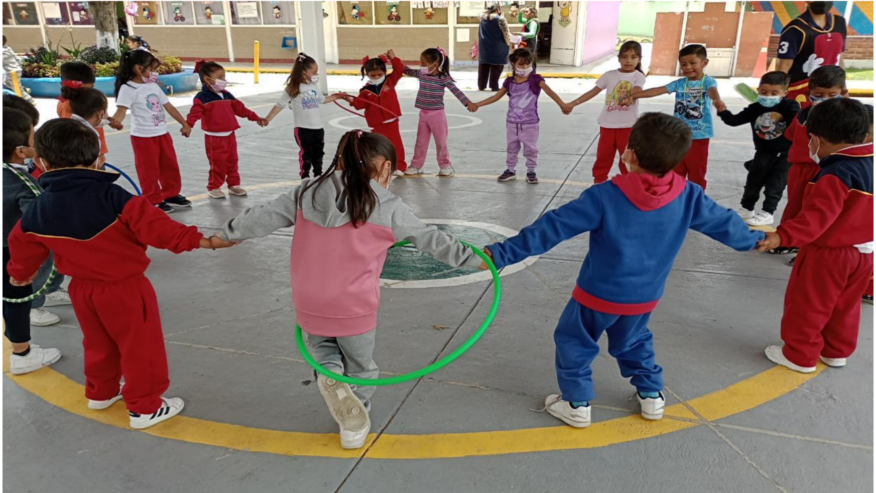
(Juego 1: "La rueda de San Miguel")