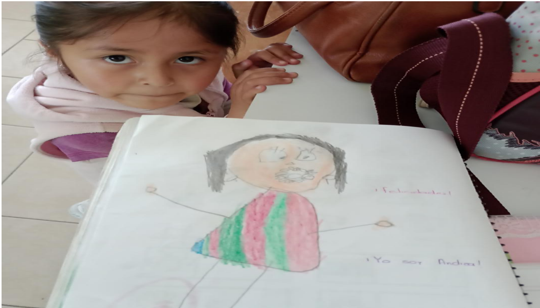
(Juego 2: "¿Por qué soy así?")