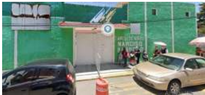
Fachada de la institución

El Jardín de Niños “Narciso Basolss” se encuentra ubicado en la calle Lago Peipus no. 609, Colonia El Seminario primera Sección, C.P. 50170 Toluca de Lerdo, México.