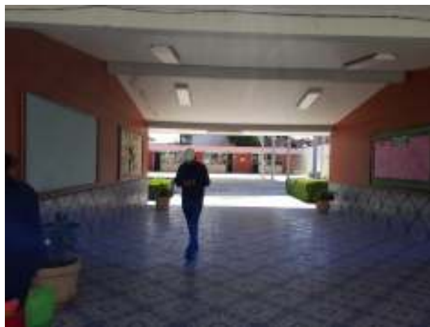
Pórtico de la escuela