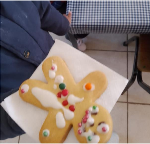
Fotografía #. 9. Alumno del jardín realizando la actividad “Mis costumbres y tradiciones”