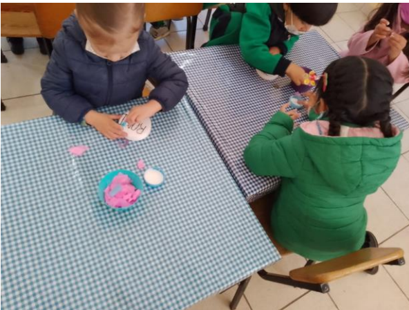
Fotografía #. 7. Alumnos del jardín realizando la actividad “festividades y conmemoraciones”