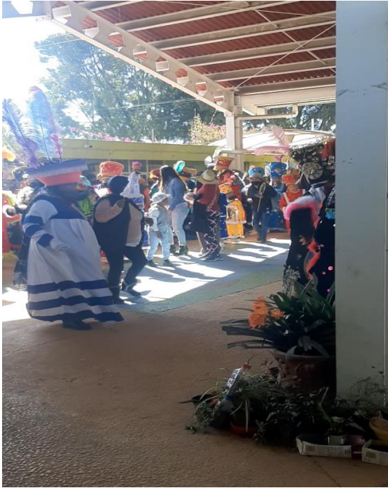
Fotografía #. 13. Padres de familia y alumnos del jardín realizando la actividad “Participando en las tradiciones