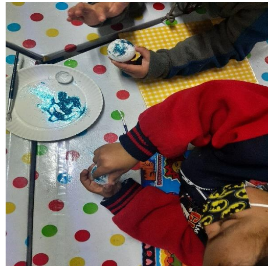
Fotografía #. 8. Alumnos del jardín realizando la actividad “festividades y conmemoraciones”