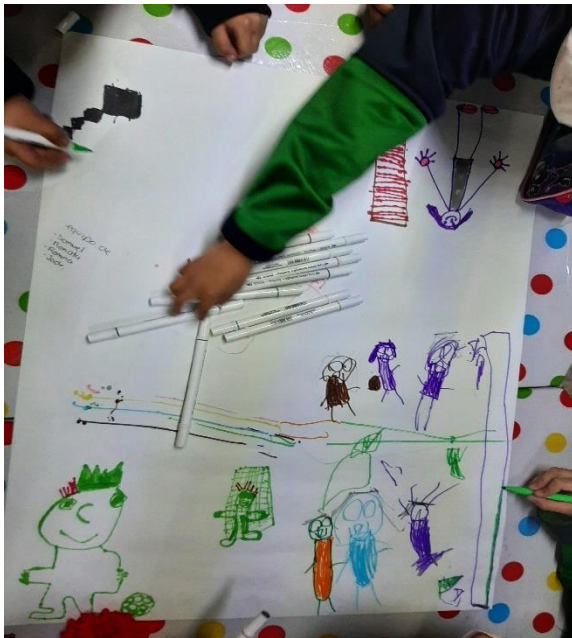
Fotografía #. 11. Alumnos del jardín realizando la actividad “Participando en las tradiciones de mi comunidad”