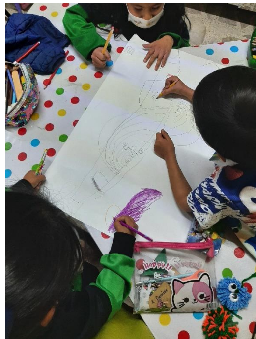
Fotografía #. 12. Alumnos del jardín realizando la actividad “Participando en las tradiciones de mi comunidad”