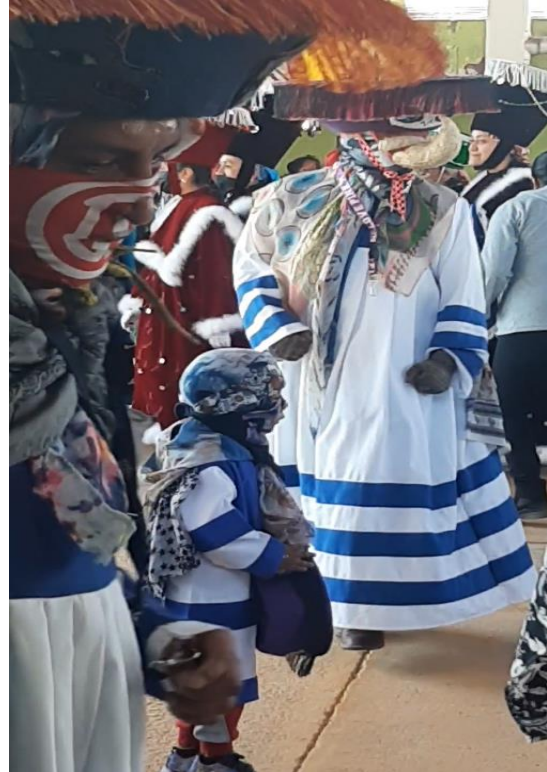
Fotografía #. 14. Padres de familia y alumnos del jardín realizando la actividad “Participando en las tradiciones