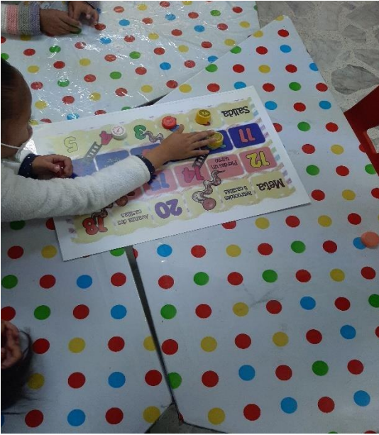
Fotografía #. 5. Alumna del jardín realizando el juego de la actividad “Costumbres en mi familia”