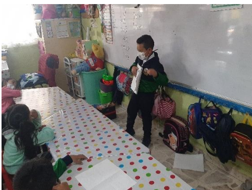
Fotografía #. 3. Alumno del jardín participando en la actividad “¿Qué es lo que se de las costumbres y tradiciones?”