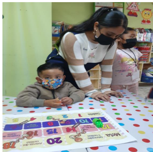
Fotografía #. 4. Alumno del jardín realizando el juego de la actividad “Costumbres en mi familia”