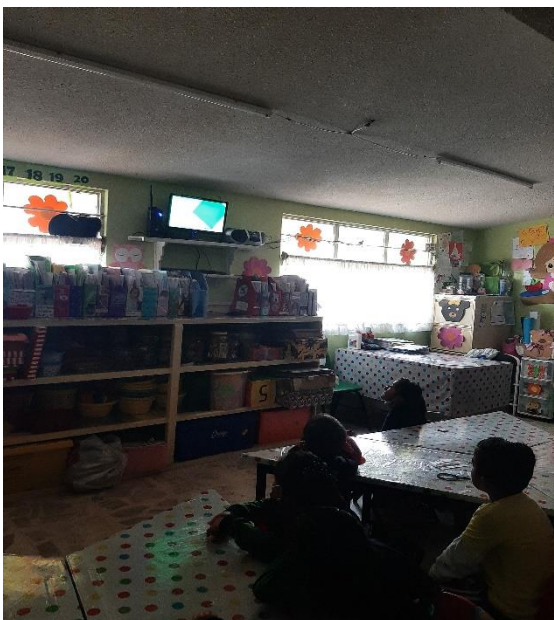
Fotografía #. 1. Alumnos observando la proyección del video de la actividad “¿Qué es lo que se de las costumbres y tradiciones?”

Las siguientes fotografías fueron tomas por la docente en formación durante la jornada de intervención en la aplicación de la propuesta.