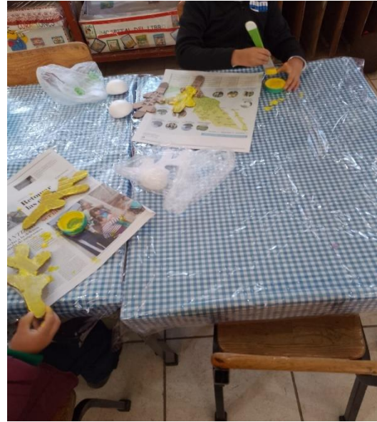
Fotografía #. 6. Alumnos del jardín realizando la actividad “festividades y conmemoraciones”