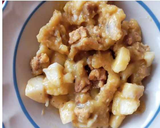
Fotografía #. 10. Platillo elaborado por un alumno del jardín para la actividad “Mis costumbres y tradiciones”