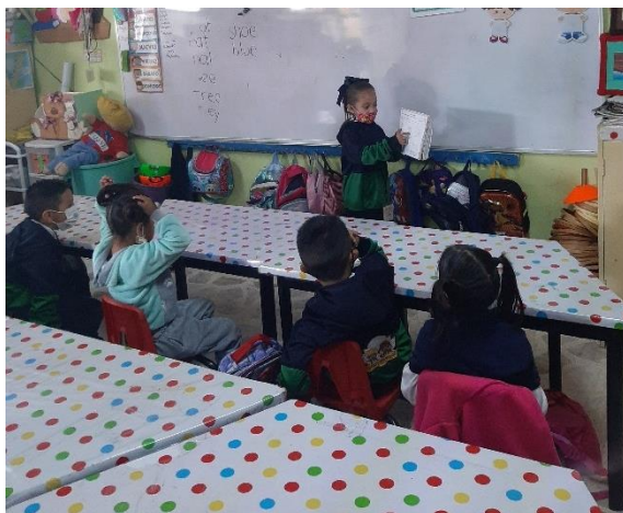
Fotografía #. 2. Alumna del jardín participando en la actividad “¿Qué es lo que se de las costumbres y tradiciones?”