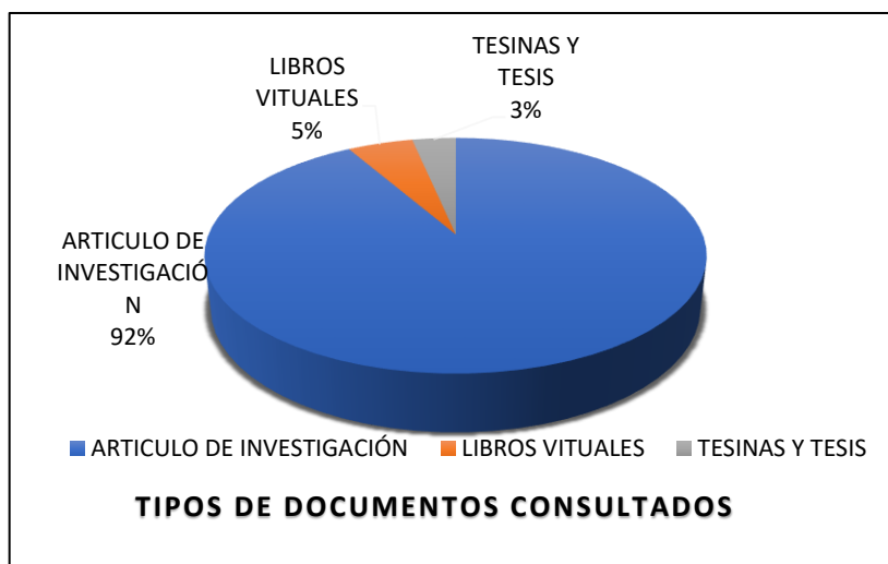
Gráfico de elaboración propia

La investigación documental que se lleva a cabo con los documentos mencionados es una investigación basada en la unidad de análisis de los propios documentos.