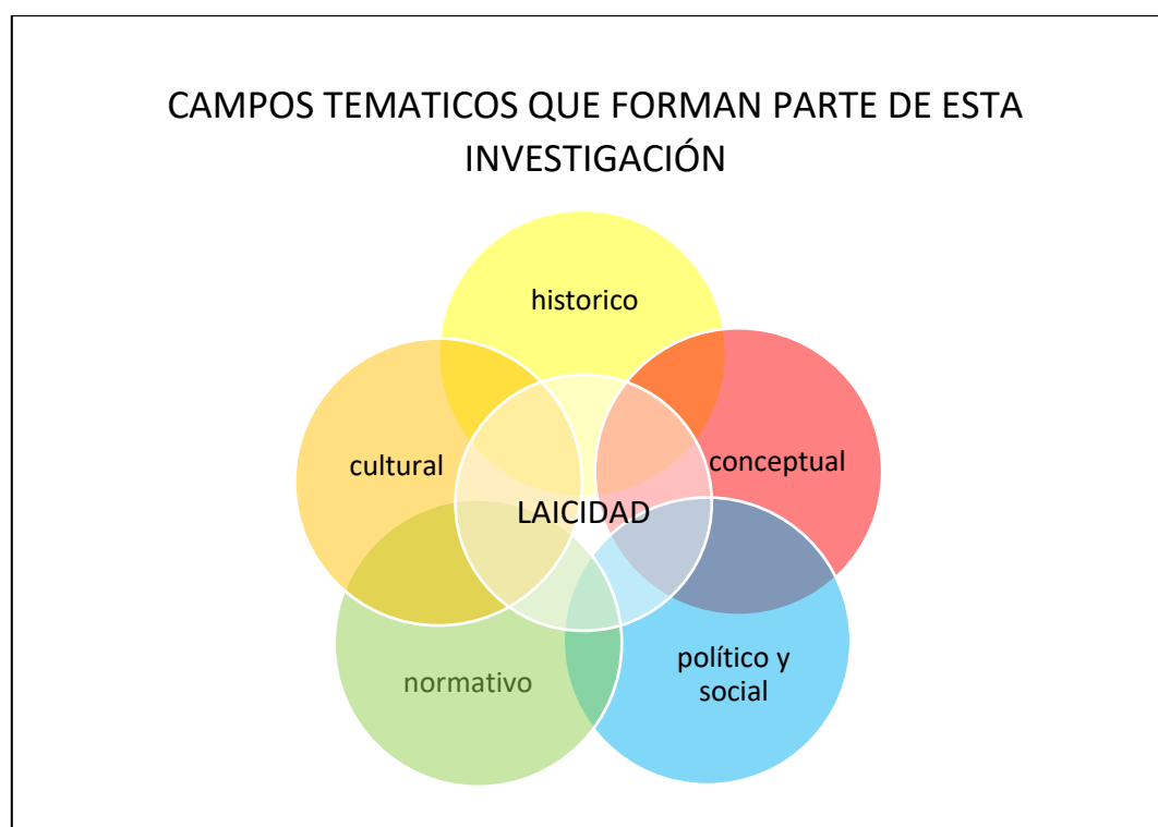
Imagen 6. Campos temáticos

Además, permite establecer las clasificaciones o campos temáticos que se pueden desarrollar, Para propósito de este trabajo destacan los siguientes campos temáticos que serán desarrollados en la siguiente unidad y que se muestran en la imagen 6.