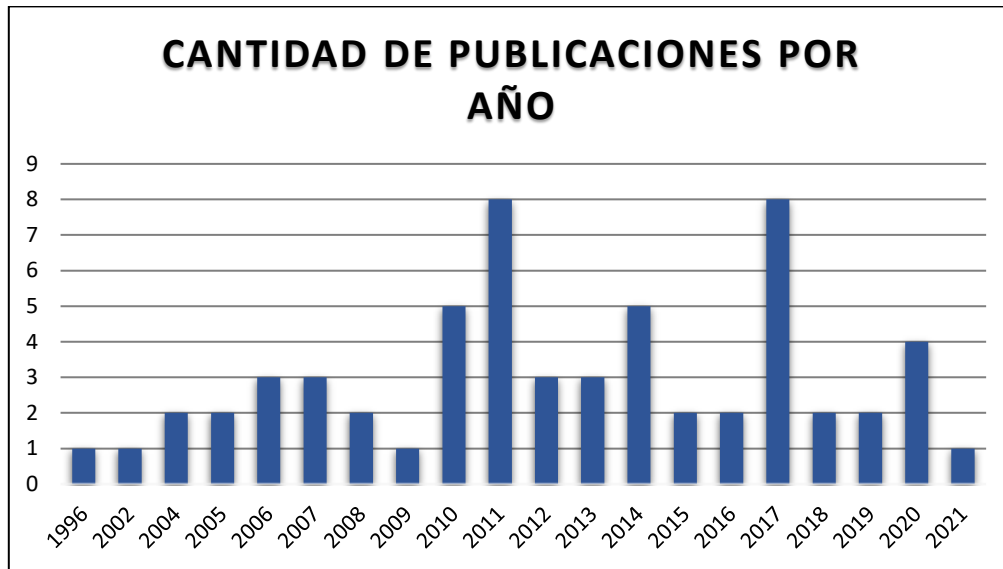
Gráfico de elaboración propia