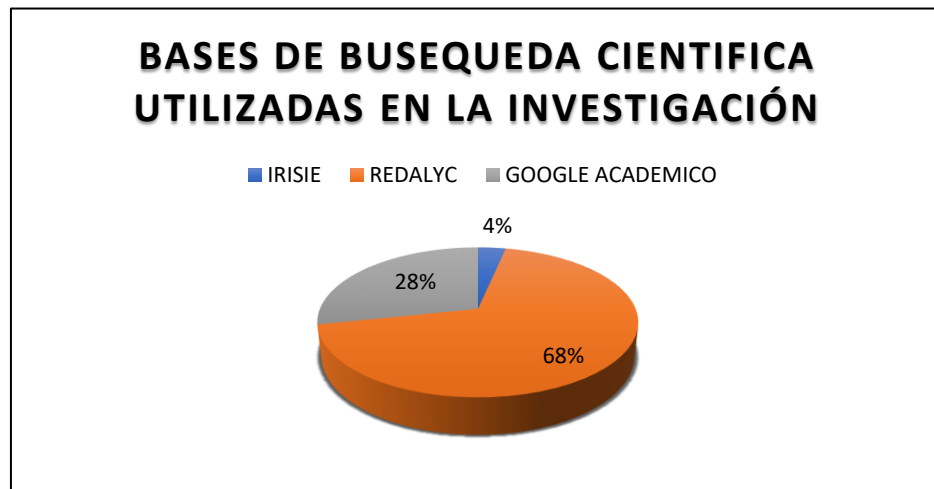
Gráfico de elaboración propia

La investigación documental depende fundamentalmente de la información recogida en los documentos obtenidos, en la investigación documental cualitativa centra su interés en el pasado o presente cercano, mientras que la investigación documental de tipo histórico pretende comprender un fenómeno histórico. La investigación histórica realiza la recopilación de datos en busca reconstruir el pasado de manera objetiva y exacta. Debido a esto, se utilizan un sin número de ciencias, métodos e instrumentos con el propósito de obtener conclusiones validas sobre un área de interés. La investigación histórica Intenta buscar una verdad objetiva. Una de sus características es deductiva-inductiva. Deductiva, se refiere al método de razonamiento que lleva a la conclusión de lo general a lo particular.