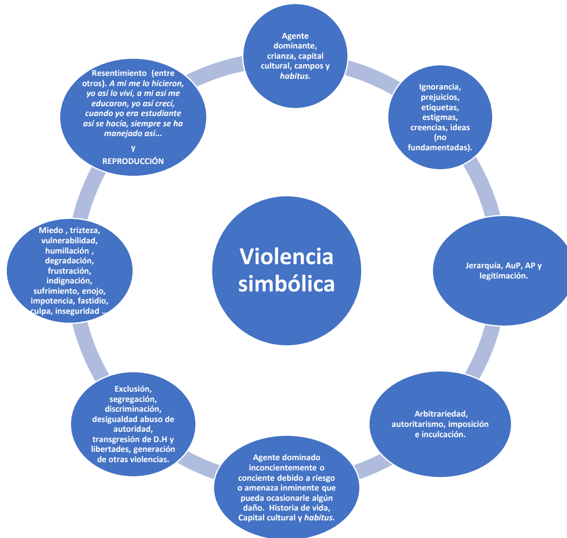
Figura 4. Diagrama de elaboración propia. Ciclo de la violencia simbólica.