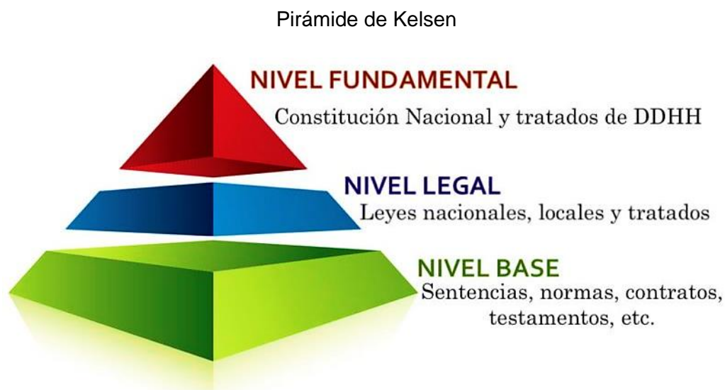
Figura 2. Nota. Adaptado de Pirámide de Kelsen representa la relación vertical entre las normas jurídicas. Tomada de Pirámide de Kelsen [imagen], Concepto, s.f, https://concepto.de/piramide-de-kelsen/

Existe un principio de jerarquía de poder en cuanto a las leyes, el cual fue propuesto por un filósofo llamado Hans Kelsen, en la que representó mediante una pirámide, que la Constitución Política (en este caso la CPEUM), es la ley máxima y ninguna ley inferior puede contradecir a la constitución o ley superior, misma que se establece en el artículo 133 de la CPEUM, entendiendo siempre como eje rector al principio pro persona, en cuestión de tratados internacionales en cuanto a derechos humanos, mismos que son igualados en jerarquía a la Constitución.