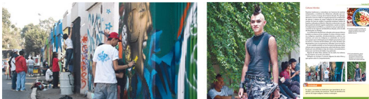
Figura 3. Nota. Adaptado de En la diversidad de las culturas que hoy conviven en México encontramos expresiones que identifican a sus autores como miembros de un grupo particular (p.109), por SEP, 2022, SEP.

En el libro de texto de Geografía, cuarto grado de la SEP, aparece como contenido del bloque a trabajar con los alumnos La diversidad cultural en México y el tema de La cultura en México con el subtema Culturas híbridas , en el cual se hace mención de las tribus urbanas como grupos que se encuentran integrados por jóvenes, los cuales se identifican con algún tipo de música, vestimenta, forma de hablar, y según sus gustos, forman parte de los darks, los rokeros, hip-hoperos, los punks y skaters como grupos que forman parte de la diversidad cultural de nuestro país. Así mismo con el aprendizaje esperado Valora la diversidad cultural de la población en México , mismo contenido que se sigue repitiendo en educación básica.