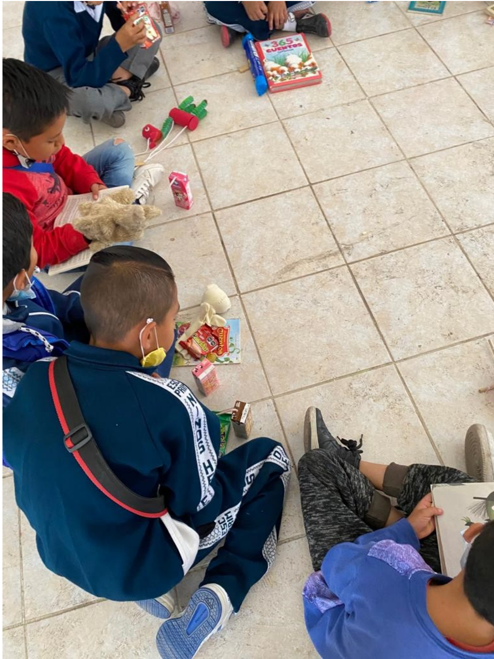
Imagen 5. Actividad “Desayuno literario”