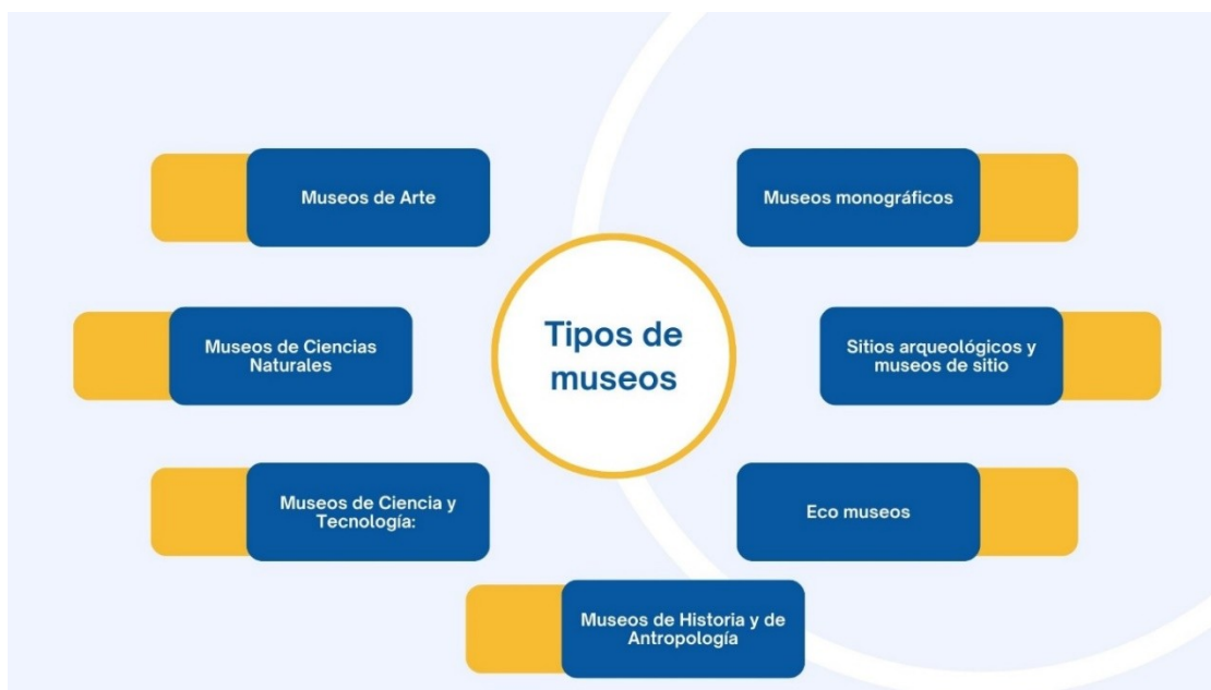
Esquema 2: Tipos de museos según Dujovne, Calvo, & Staffora, 2001. (elaboración propia)

De acuerdo a los objetos y el patrimonio que nos muestran los museos, así como, la forma en que se organizan sus salas y temáticas, según (Dujovne, Calvo, & Staffora, 2001), señalan que los museos se pueden clasificar de la siguiente manera: