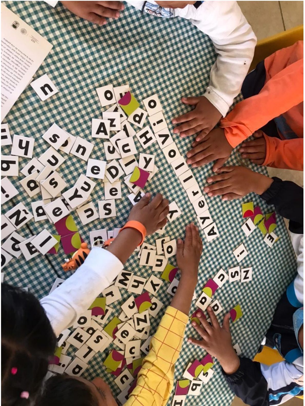
Imagen 15. “Torneo de juegos formando palabras” Se comienza a incluir a los estudiantes con diferentes niveles de habilidad y conocimiento, se promueve una diversidad de perspectivas en el grupo.