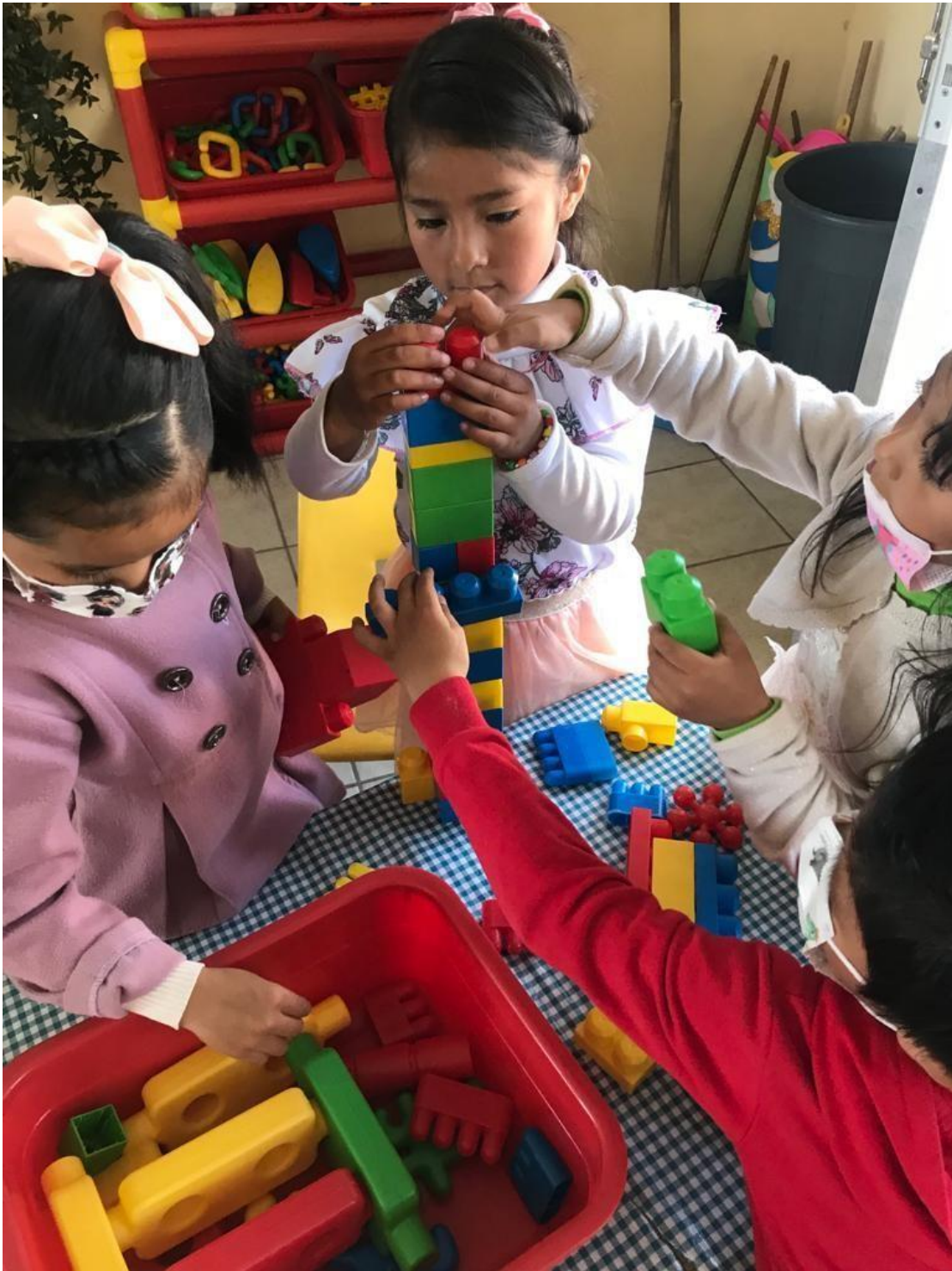
Imagen 3. Diagnóstico para valorar el trabajo cooperativo cuando existe un vínculo armonioso entre todos los integrantes del equipo.