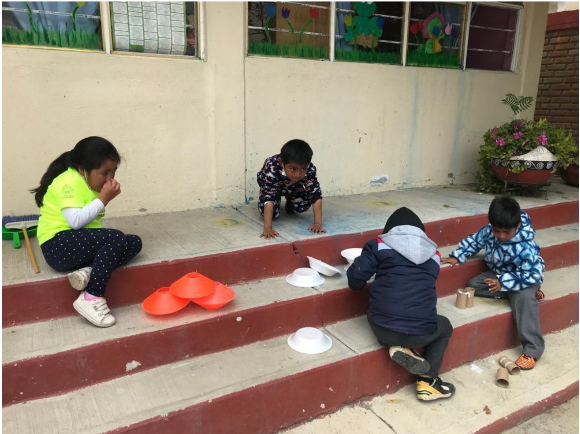
Imagen 4. “El lobo y los tres cerditos” Falta de apoyo mutuo entre los integrantes del equipo.