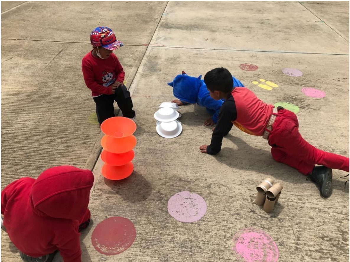
Imagen 7. “El lobo y los tres cerditos” Se valoró la diversidad de ideas y perspectivas.