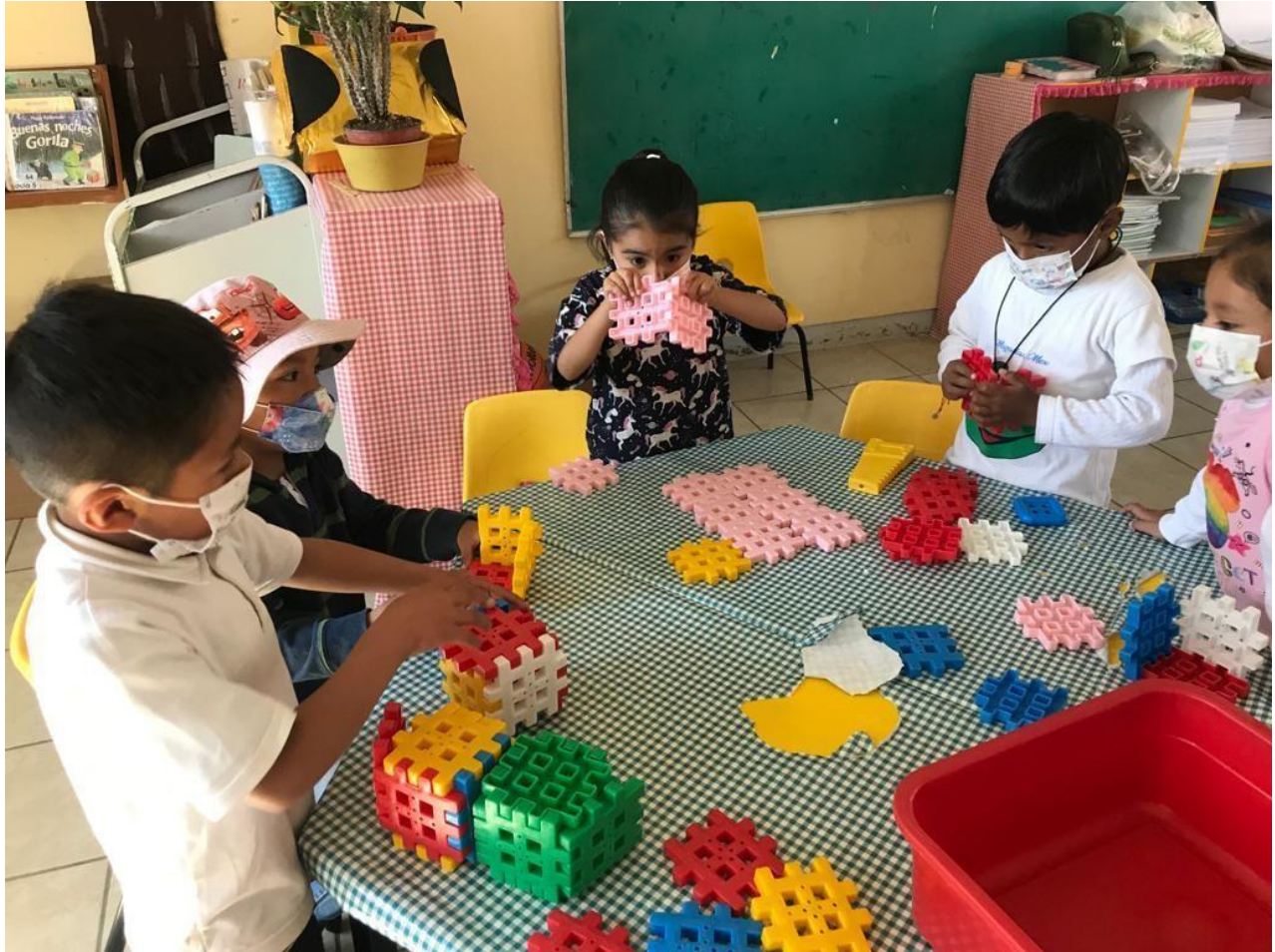
Imagen 1. Diagnóstico para valorar el trabajo cooperativo.