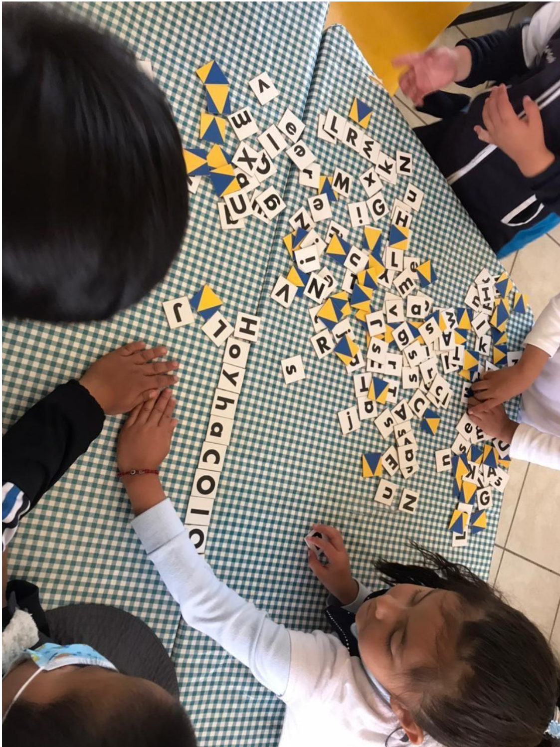
Imagen 13. “Torneo de equipos formando palabras”. Se muestra la orientación de los compañeros más experimentados, lo que les permite superar obstáculos y mejorar su aprendizaje.