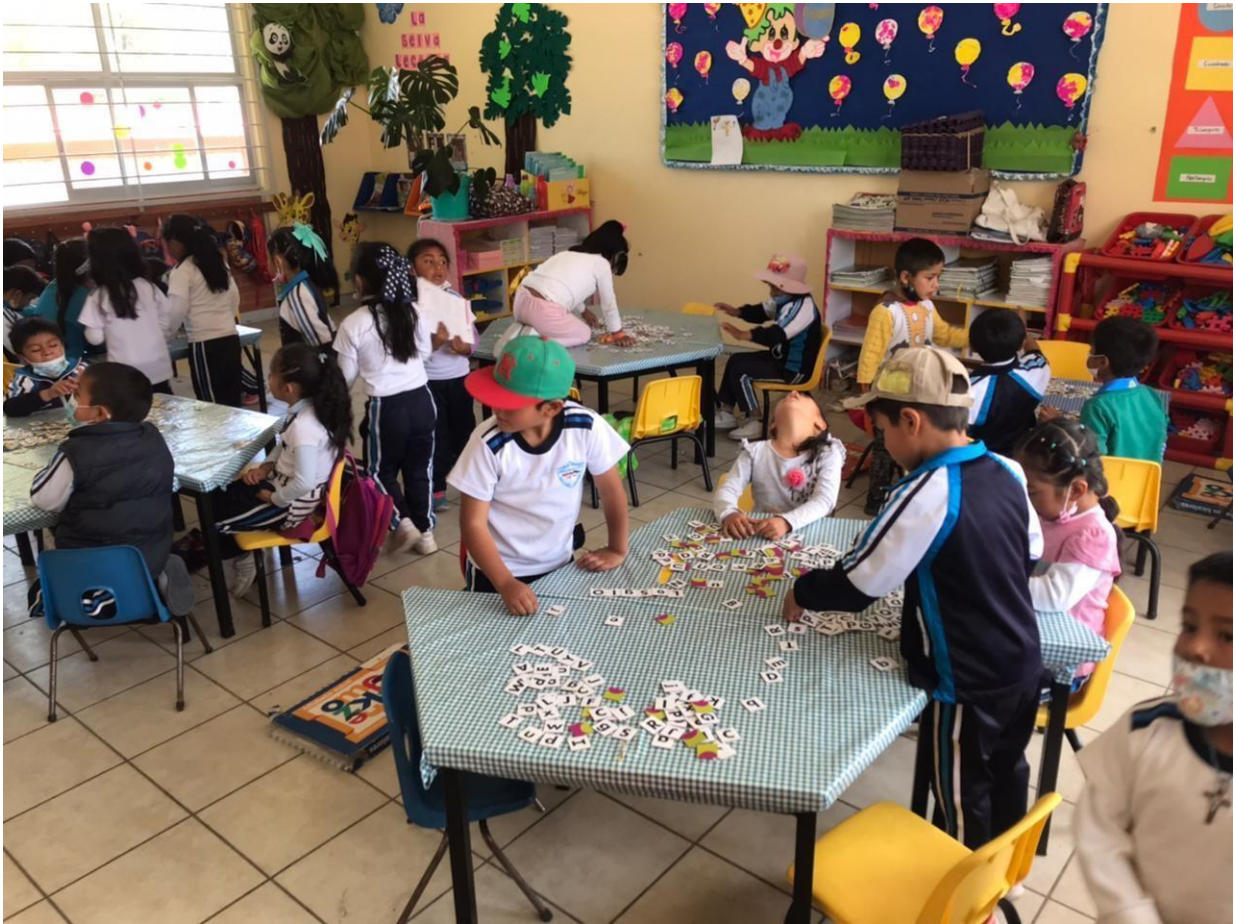
Imagen 8. “Torneo de equipos formando palabras” El equipo muestra la individualidad trabajando con una meta propia.