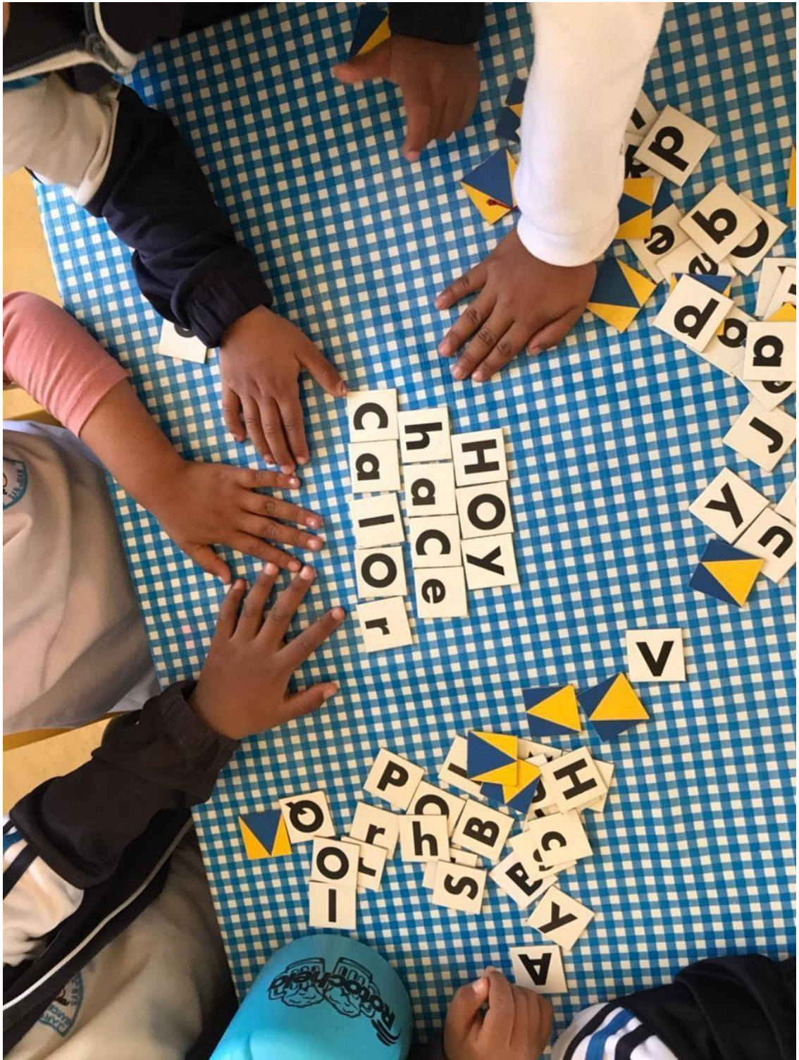
Imagen 16. “Torneo de equipos formando palabras” Los estudiantes más avanzados brindan apoyo y orientación a los menos avanzados. Esto crea un ambiente de aprendizaje solidario, donde los estudiantes se sienten respaldados y motivados para superar desafíos.