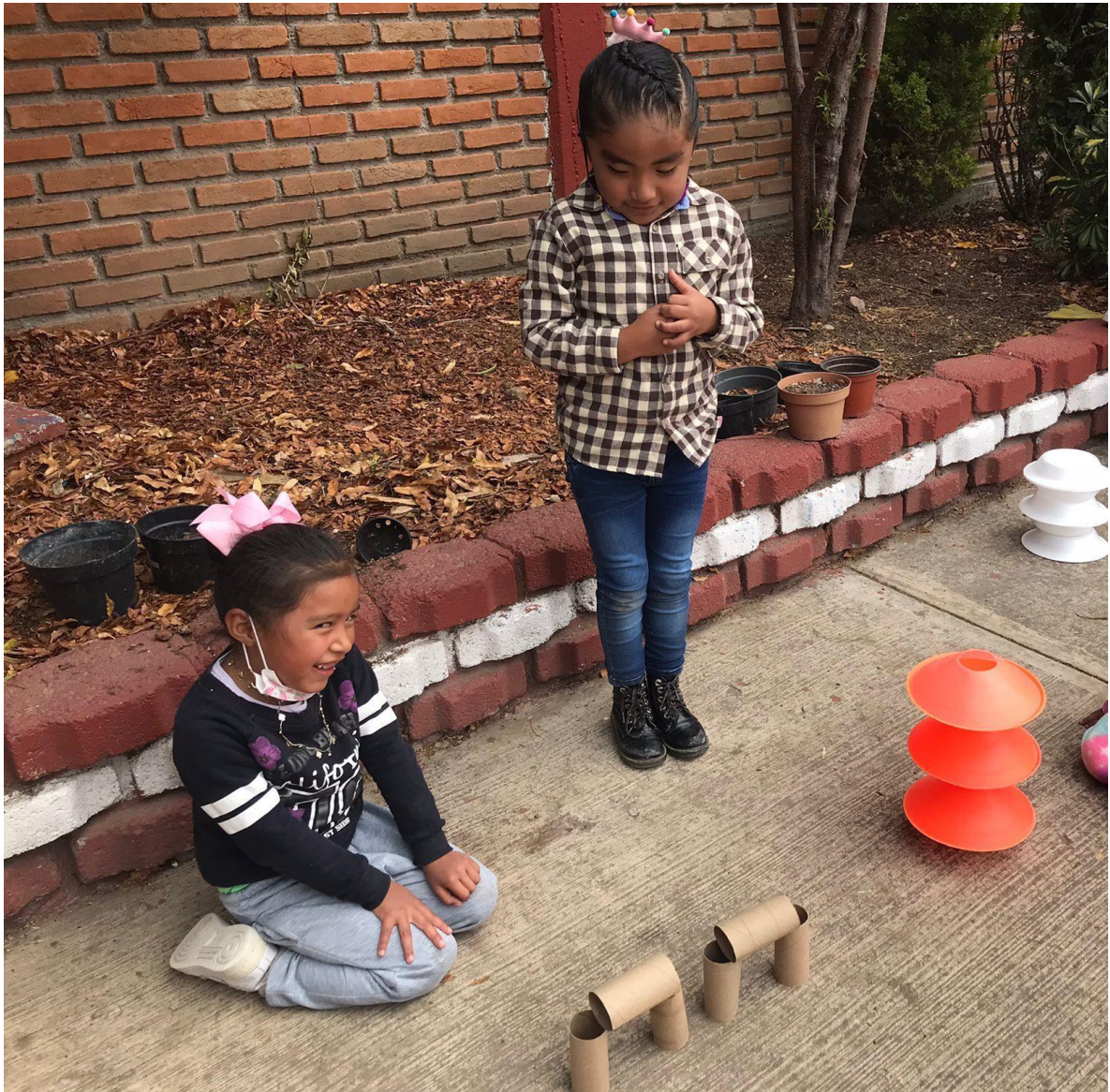
Imagen 5. “El lobo y los tres cerditos” Construcción activa de conocimientos compartidos.