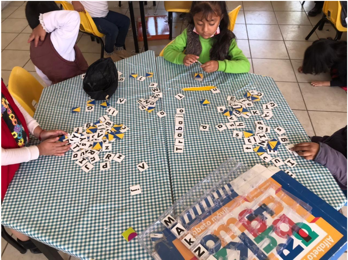
Imagen 17. “Torneo de equipos formando palabras” Logro del trabajo en equipos mixtos, se logra el reforzamiento del aprendizaje.