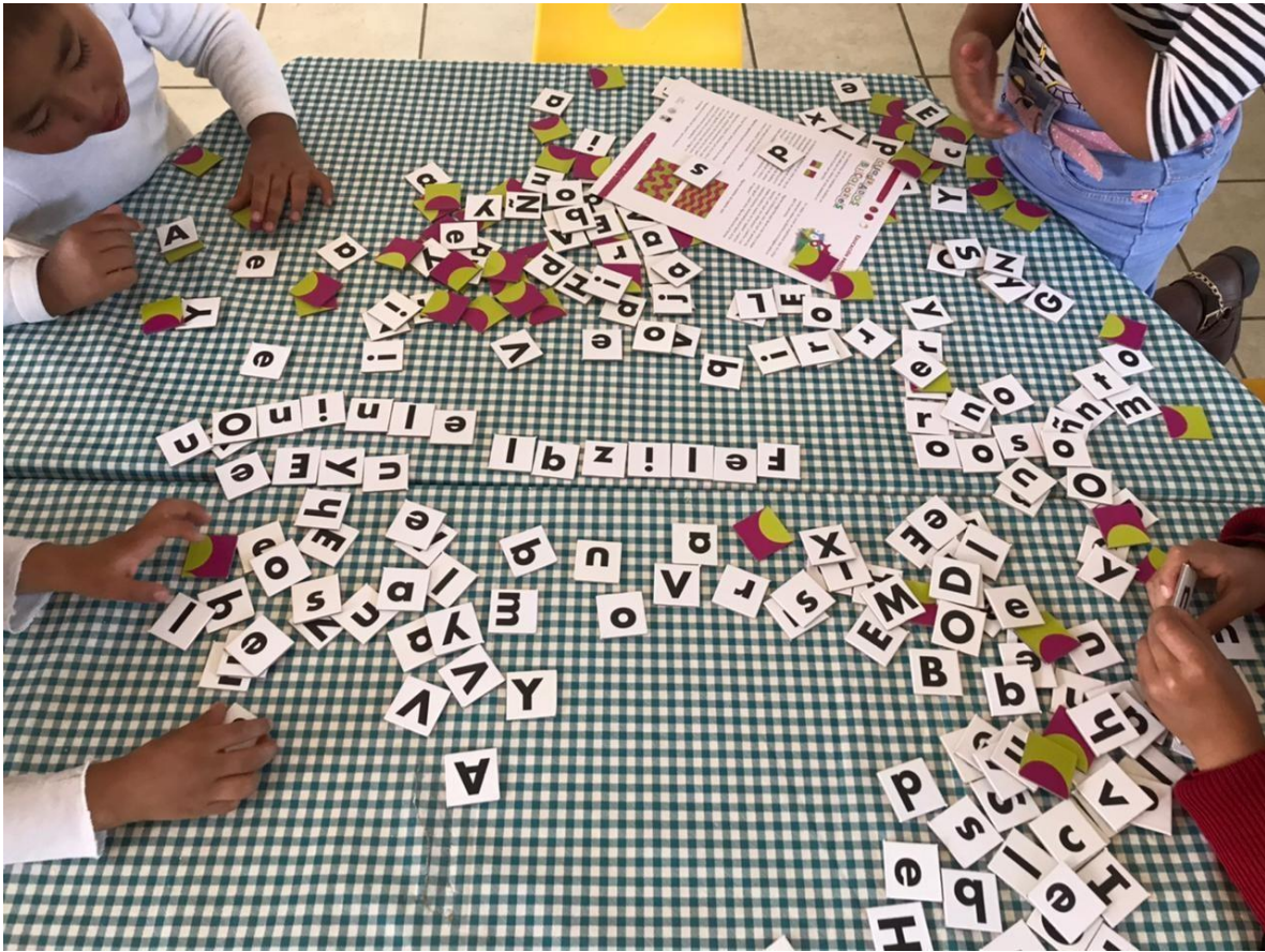
Imagen 11. “Torneo de juegos formando palabras” Se comienzan a familiarizar con el trabajo en equipos mixtos