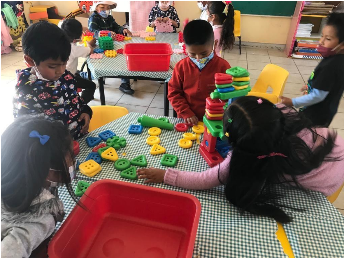
Imagen 2. Diagnóstico para valorar el trabajo cooperativo cuando existe un vínculo solo en pocos integrantes del equipo.