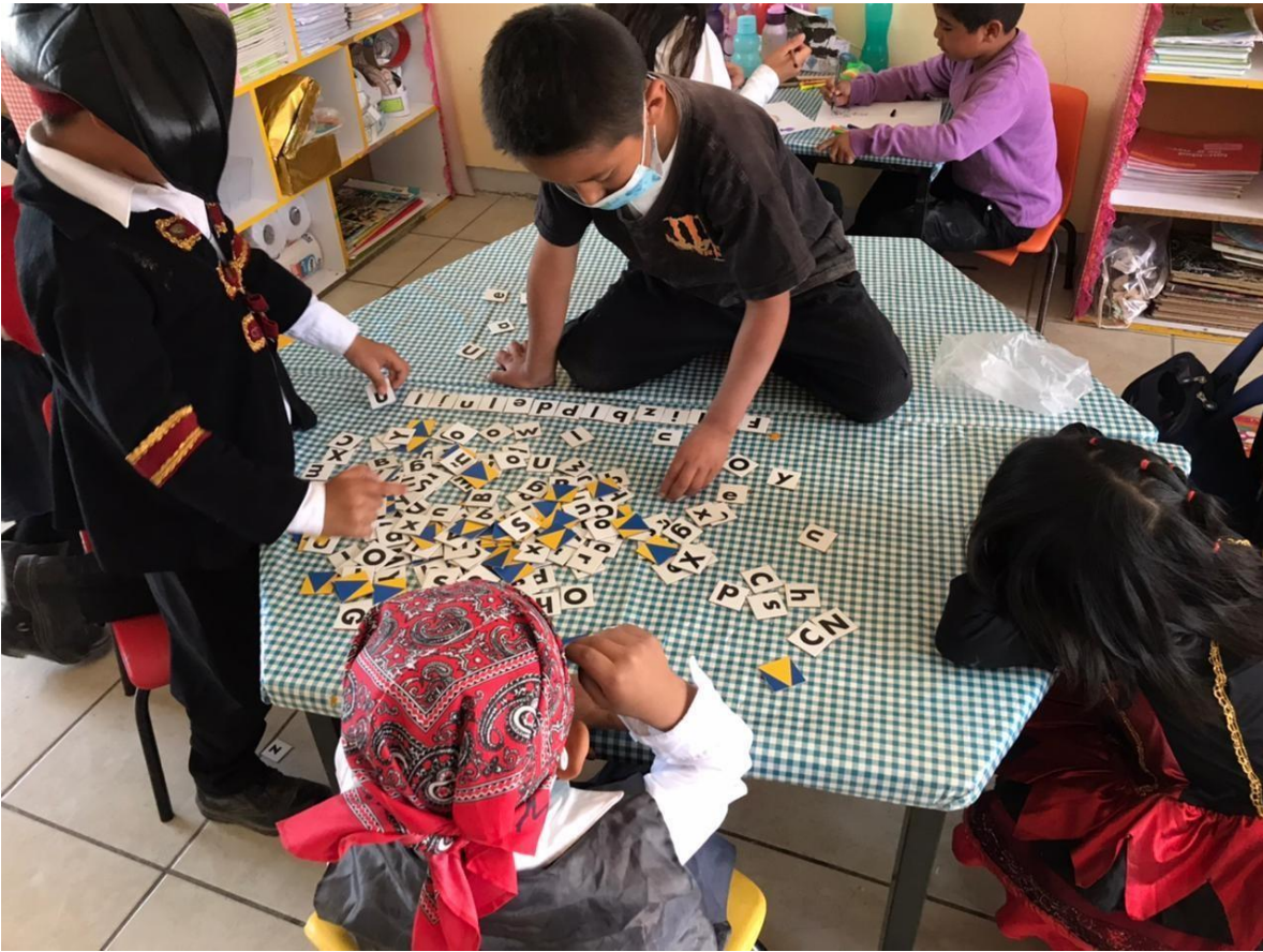
Imagen 9. “Torneo de equipos formando palabras” Se muestra los diferentes niveles de aprendizaje.