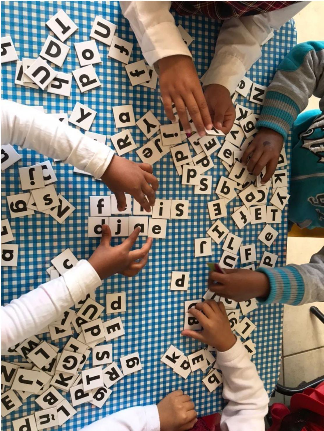
Fotografía 12. “Torneo de equipos formando palabras”. Se comienza a fomentar la colaboración, la solidaridad y el trabajo en equipo.