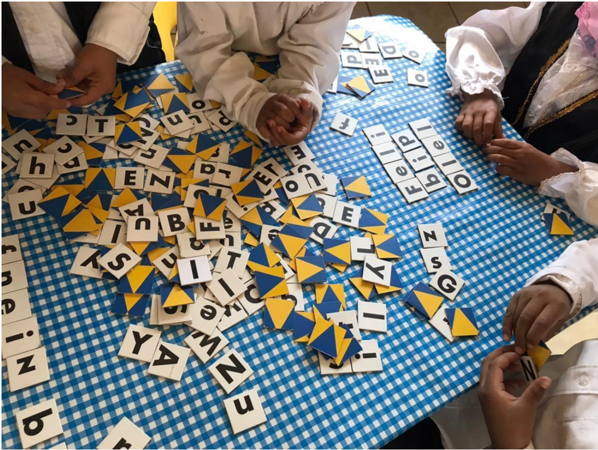
Imagen 10. “Torneos de equipos formando palabras” Se muestra los vínculos armoniosos en pares.