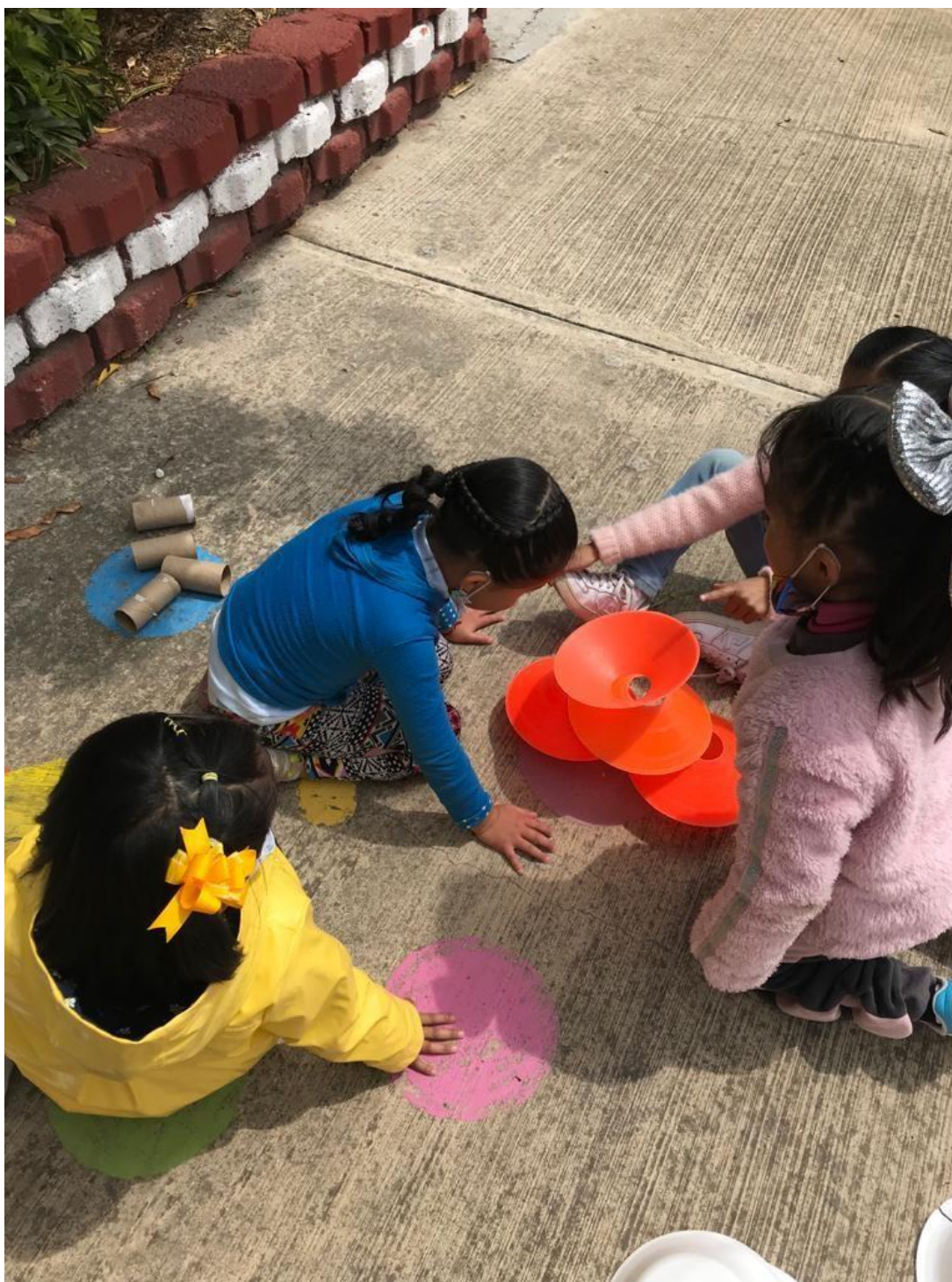
Imagen 6. “El lobo y los tres cerditos” El aprendizaje cooperativo fomentó la participación de todos los estudiantes.