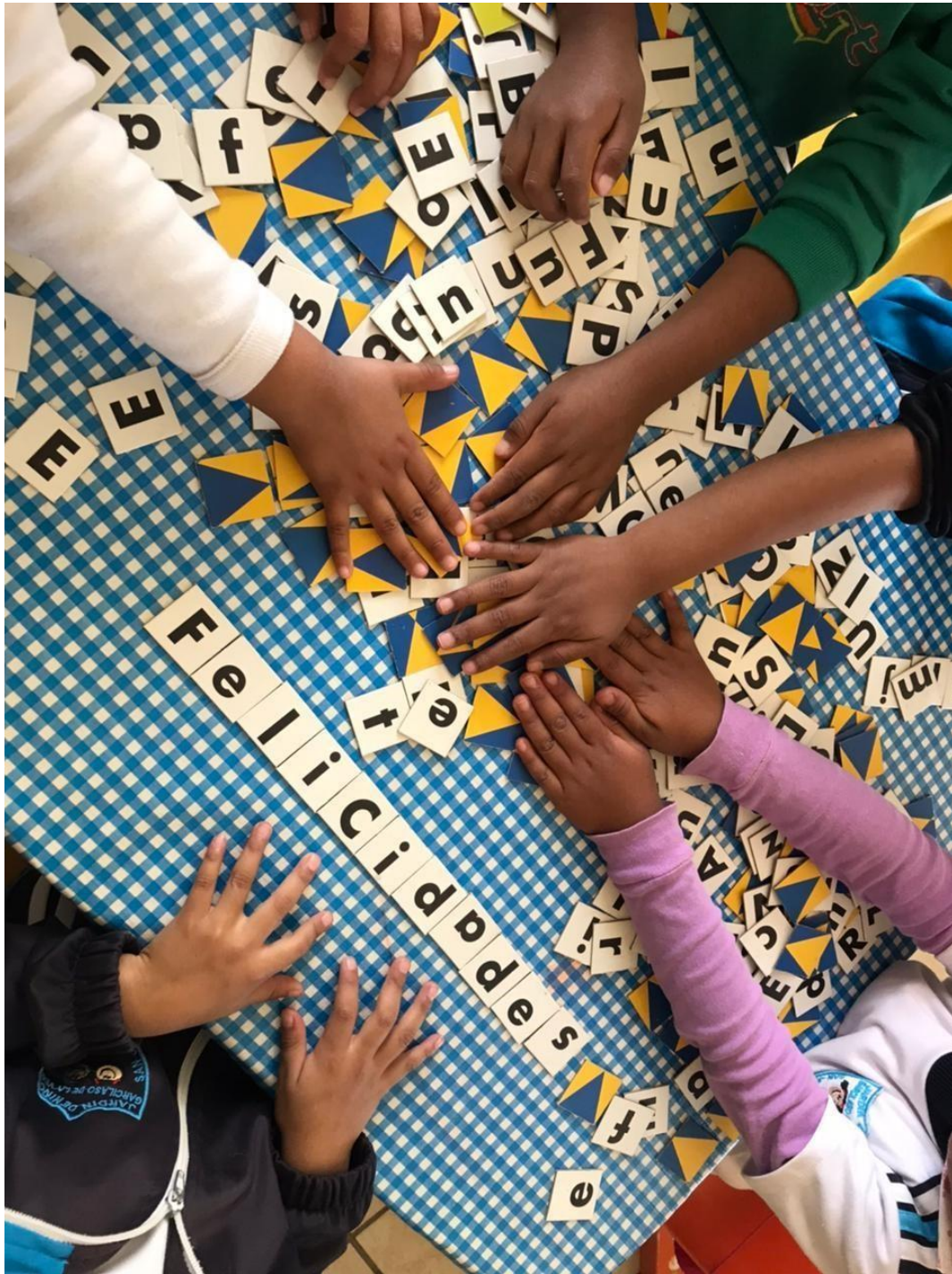
Imagen 14. “Torneo de juegos formando palabras” Trabajando en equipo, los estudiantes pueden complementar sus fortalezas y superar sus debilidades individuales.