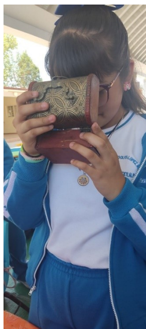
Ilustración 2 Evidencia actividad realizada con los alumnos de 5°C