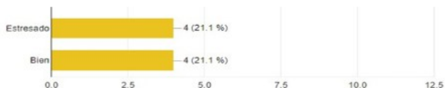
Ilustración 2 Resultado de los alumnos en donde se muestra el porcentaje de emociones durante las actividades escolares