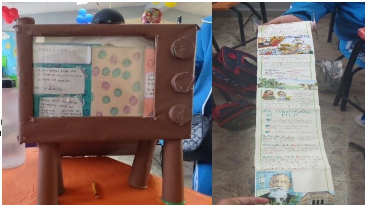
Ilustración 1 Productos elaborados dentro de la asignatura de Historia