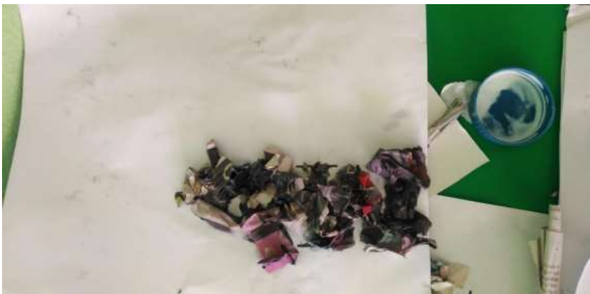
Imagen. 3 actividad Mi nombre para identificar nuestras pertenencias.