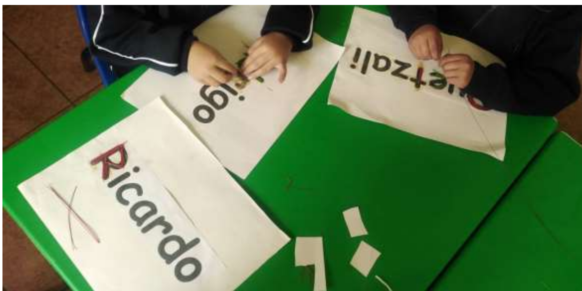
Imagen. 7 Mi nombre técnica de popotillo