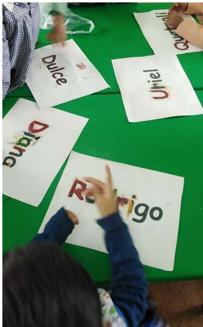
Imagen 4. Mi nombre técnica de popotillo