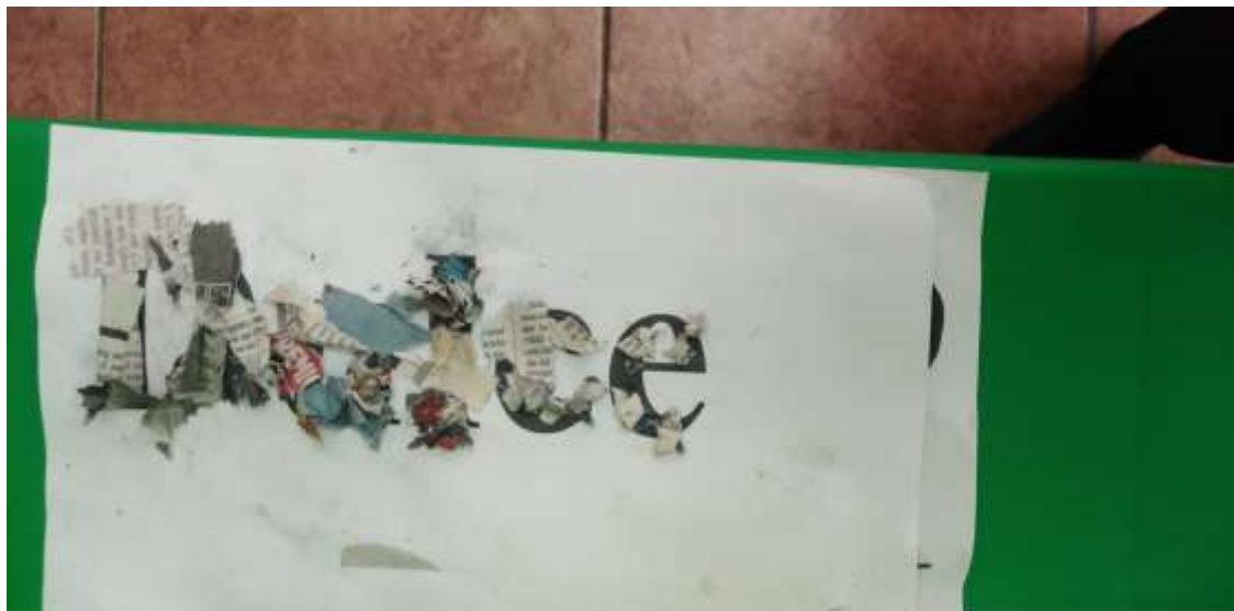
Imagen. 5 actividad Mi nombre para identificar nuestras pertenencias.