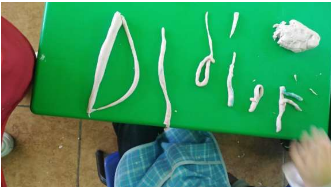
Imagen. 2 actividad modelado de mi nombre