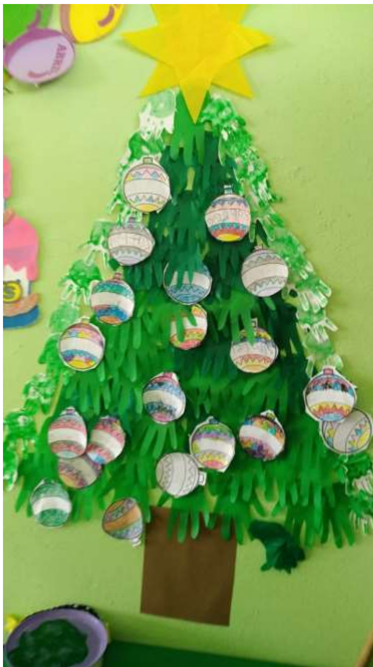
Imagen. 2 Actividades. Árbol de Navidad y Esferas Navideñas