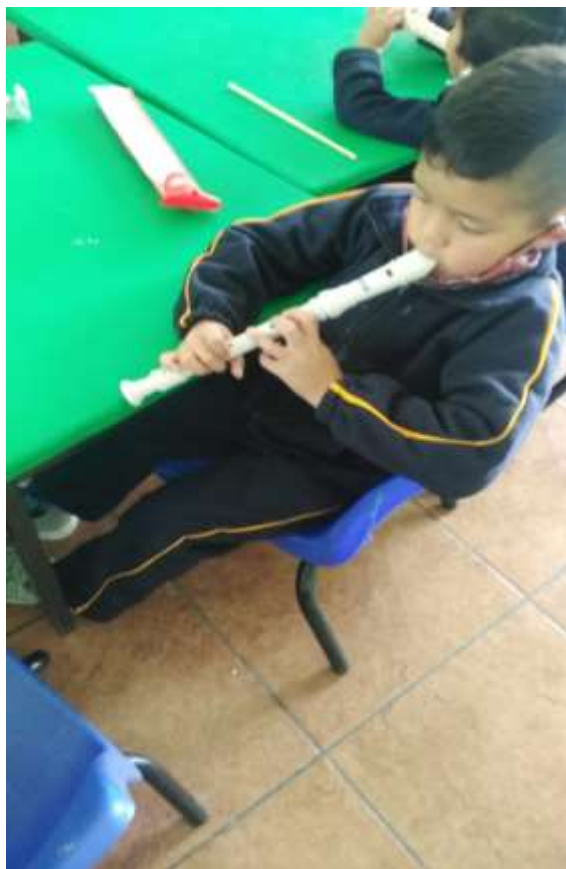
Imagen. 1 Actividad. Implementación de la flauta.