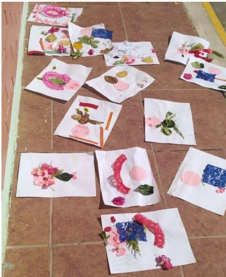
Imagen. 1 Actividad collage