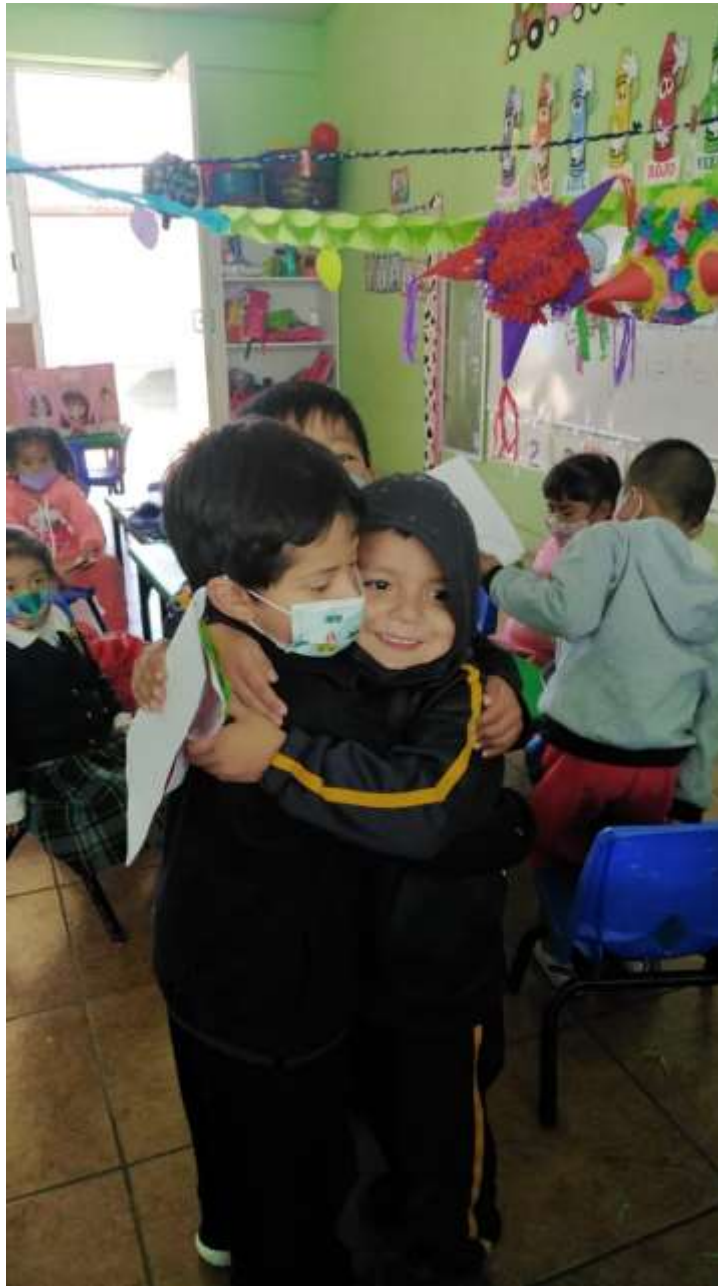
Imagen. 1 Actividad. Intercambio de tarjetas