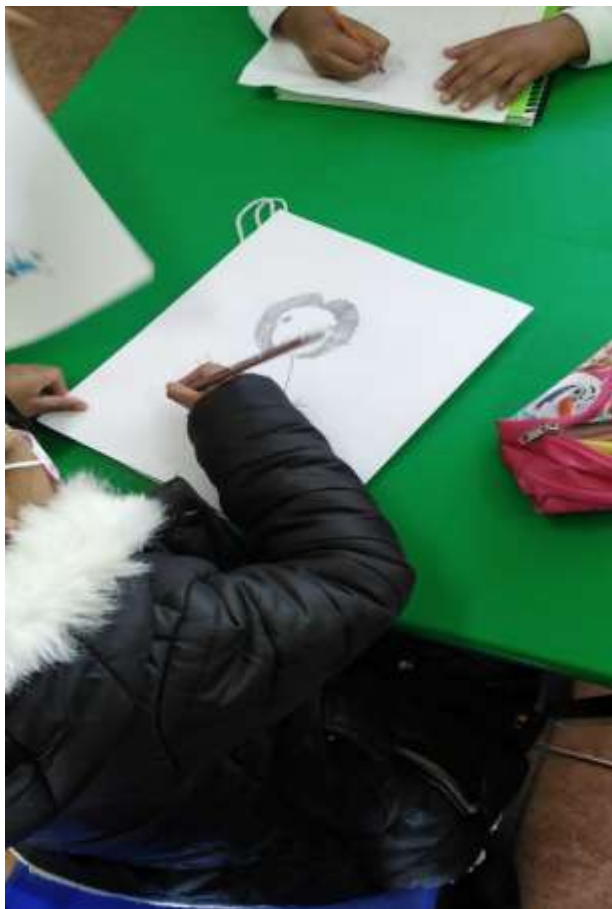
Imagen. 8 Yo me llamo