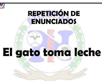
Ilustración 8 Instrumento para evaluar el lenguaje oral

Durante esta evaluación se le pidió al alumno que realizará la repetición de dichas palabras.