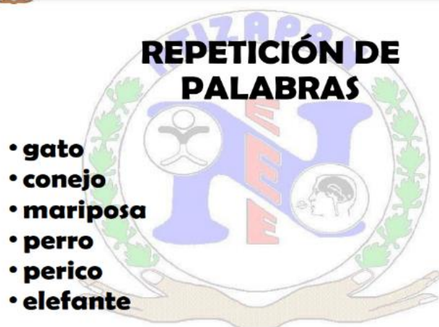
Ilustración 1 Instrumento para evaluar el lenguaje oral

A continuación, se muestran imágenes que representan y explican el instrumento de evaluación utilizado (Ver anexo 1):