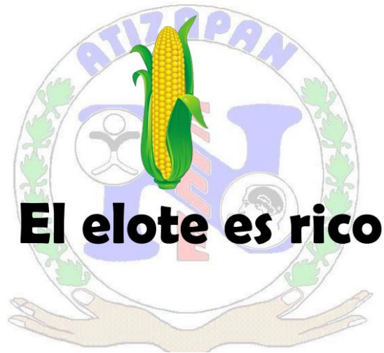
Ilustración 6 Instrumento para evaluar el lenguaje oral

Durante esta evaluación se agregó una imagen como apoyo y se pidió al alumno que hiciera la repetición del enunciado con apoyo de la imagen. Ahora debía mostrar dónde se encontraba la imagen del “elote” al señalarla.