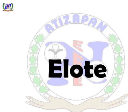
Ilustración 9 Instrumento para evaluar el lenguaje oral

Durante esta evaluación se pidió a los alumnos que realizarán la repetición del enunciado de acuerdo con la palabra seleccionada.