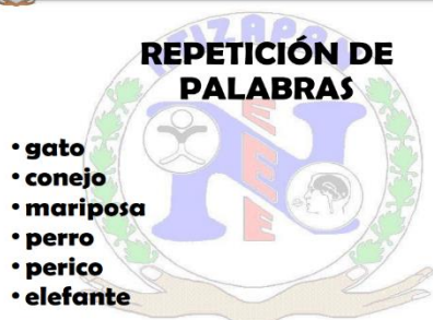
Ilustración 7 Instrumento para evaluar el lenguaje oral

Durante esta evaluación se le pidió al alumno que realizará la repetición de dichas palabras.