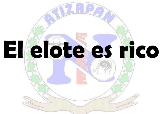
Ilustración 5 Instrumento para evaluar el lenguaje oral

Durante esta evaluación subió la complejidad, ahora se pidió al alumno que nuevamente hiciera repetición del enunciado, señalando la palabra. Así mismo, se pidió nuevamente que señalará dónde se encontraba la palabra “elote”.