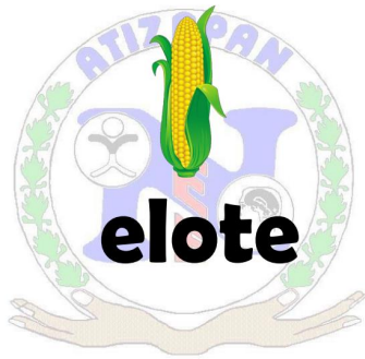
Ilustración 10 Instrumento para evaluar el lenguaje oral

Durante esta evaluación se agregó una imagen de apoyo, por lo que se pidió al alumno que realizará la repetición de la palabra y así mismo que mencionará la imagen que veía.