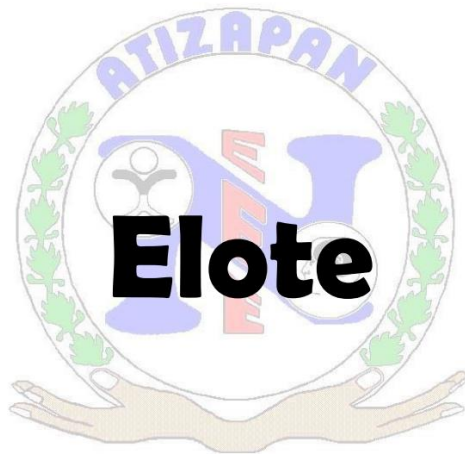
Ilustración 3 Instrumento para evaluar el lenguaje oral

Durante esta evaluación se le solicitó al alumno que hiciera la repetición de dicha palabra, así mismo se le mostró una palabra diferente y se pidió que señalará dónde se encontraba la palabra “elote”.