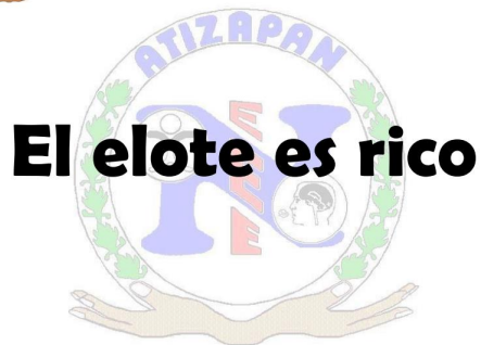
Ilustración 11 Instrumento para evaluar el lenguaje oral

Durante esta evaluación se pidió al alumno que nuevamente hiciera repetición del enunciado con la palabra señalada.