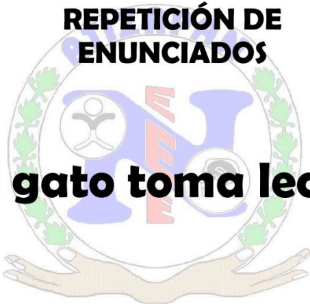
Ilustración 2 Instrumento para evaluar el lenguaje oral

Durante esta evaluación se pidió a los alumnos que realizarán la repetición del enunciado de acuerdo con la palabra seleccionada, con el propósito de que comunicara de manera oral el enunciado. Así mismo, se repetía la oración y se daba la instrucción de señalar donde se encontraba la palabra “gato”.