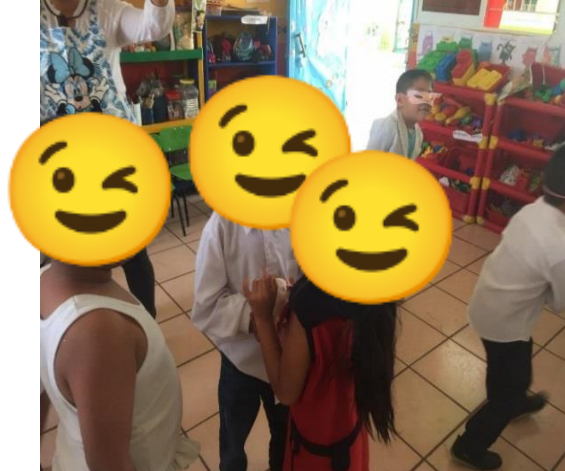
NIÑOS BAILANDO EN EL CARNAVAL.