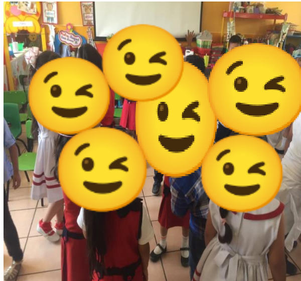
NIÑOS COLOCÁNDOSE SU ANTIFAZ.