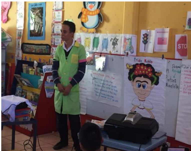
DURANTE MIS PRÁCTICAS PROFESIONALES.