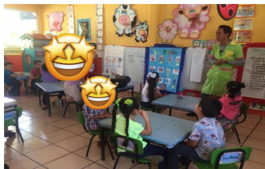
MOMENTO EN QUE ESTABLEZCO LA CONSIGNA DE LA ACTIVIDAD.