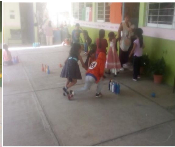
REPARTICIÓN DEL MATERIAL Y BÚSQUEDA DEL ESPACIO EN EL PATIO ESCOLAR.