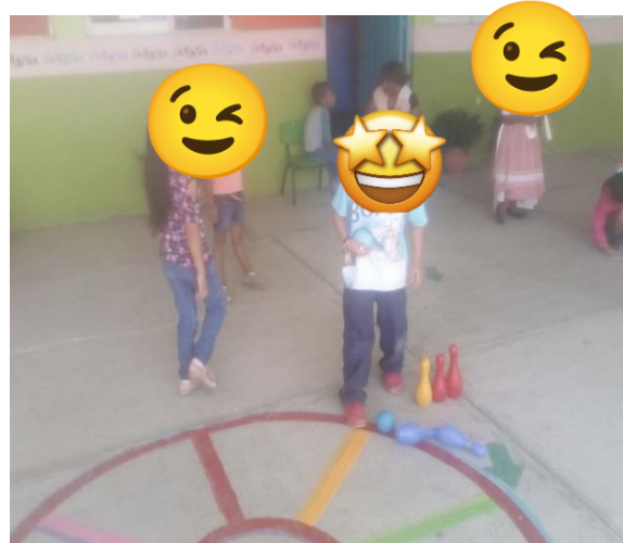
EQUIPO DE ORLANDO ACOMODANDO SUS BOLOS.