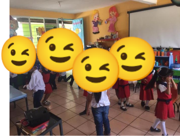
APLICACIÓN DE LA REPRESENTACIÓN DEL CARNAVAL.