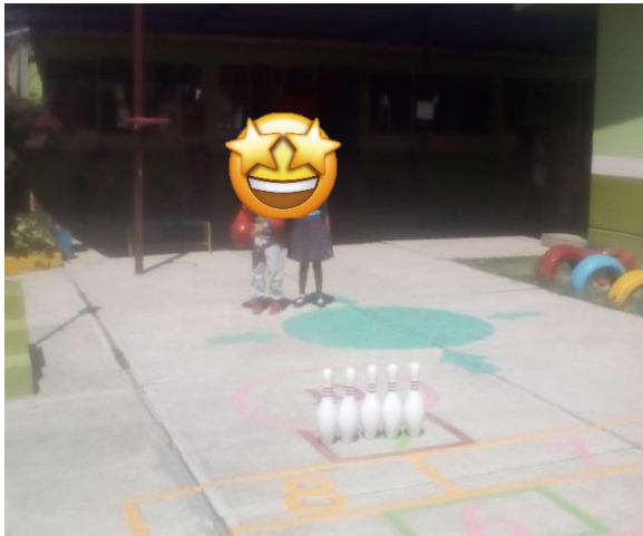
EQUIPO DE MACKENZIE COMENZANDO EL JUEGO DE BOLICHE.