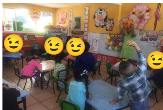
CUANDO ESTABLEZCO LA CONSIGNA DE LA ACTIVIDAD, MOSTRÁNDOLES EL DADO.