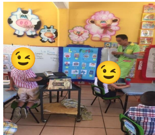
ELIGIENDO LA PARTICIPACION DE LA COLECCIÓN DE BOLOS.