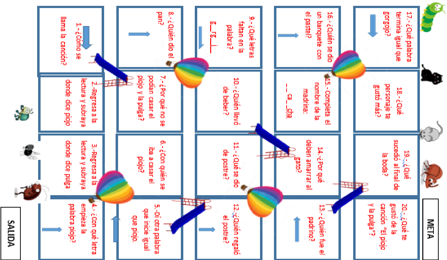
Figura 1. Material globos y resbaladillas.