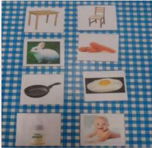
Macias. M. (2022) Método Troncoso aplicado a una alumna con síndrome Down. Figura a

En el presente video, muestro la secuencia que maneje durante la aplicación que va de lo sencillo a lo complejo, en donde las primeras actividades planteadas fueron mediante la elaboración de unas tarjetas como las que se muestran ( Figura a ), con objetos que para la alumna fueran significativos, de uso cotidiano y fáciles de pronunciar, mediante el uso de estas tarjetas jugamos memorama en donde trabajamos la pronunciación y la memoria. Posteriormente realizamos juegos de asociación y selección en donde ella identificaba objetos y los relaciona por su uso (silla es a mesa, llave es a puerta etc).