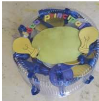
Imagen 1. Diagrama móvil en su estuche, con material reciclado.