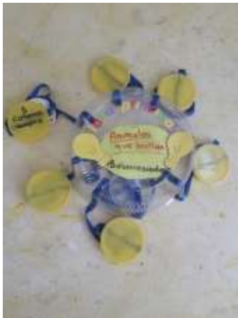
Imagen 3. Elaboración de diagrama móvil.