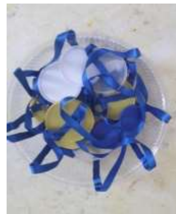
Imagen 2. Materiales para construir el diagrama móvil,