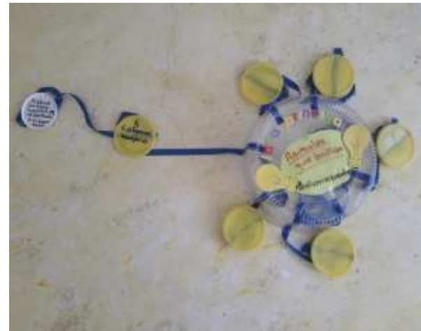
Imagen 4. Organización del diagrama móvil.