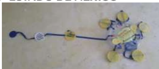
Imagen 5. Compartir diagrama con sus compañeros.