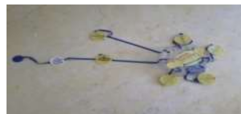
Imagen 6. Exponer diagramas.