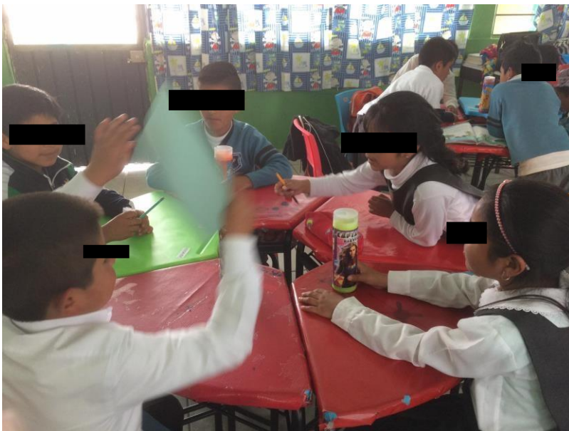
Figura 3 Actividad en desarrollo

Nota: Los alumnos analizan el cuento para desarrollar la actividad del Cuadrorama.