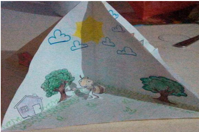
Figura 2 Palabras Escondidas.

Nota: se rescatan las cuatro ideas principales de la lectura, haciendo énfasis entre el escenario y los personajes principales (México Patente nº 1, 2017)