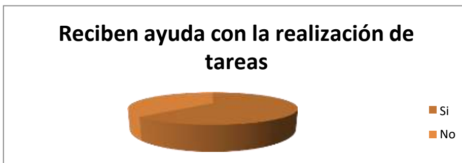
Grafica 2. Encuesta de quien de los alumnos recibe ayuda para la elaboración de tareas.

El realizar tareas es importante debido a que es una retroalimentación de lo que se ve a diario, sirve como repaso para adquirir el conocimiento; si se generan dudas poder resolverlas; es por ello que si alguien las realiza con el alumno sirve de mucha ayuda ya que si en el momento surgen complicaciones se pueda resolver al momento, aparte para que el alumno se sienta protegido y acompañado en su trayecto formativo.