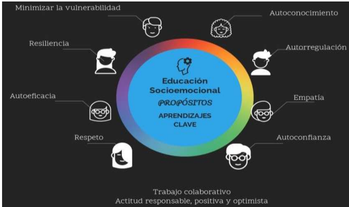
Fig. 2 Habilidades que forman parte de una personalidad positiva. Fuente de elaboración propia. Adaptada de Aprendizajes Clave, SEP. (2017).

Como se observa entre las líneas, la construcción de buenas actitudes es uno de los factores clave para la personalidad positiva, alcanzando valores óptimos mediante el ejemplo, siendo un proceso cognitivo, afectivo y conativo; es decir, implica actos volitivos que son guiados por el docente quien tiene experiencia en la construcción de escenarios posibles y viables, ayudándole a los alumnos a que sean transferibles, lo que tiende a ser más significativo, enseñándole que no solo se aplica en el entorno áulico y escolar, sino, en su contexto inmediato, a lo largo de toda su vida y para distintos objetivos y metas.