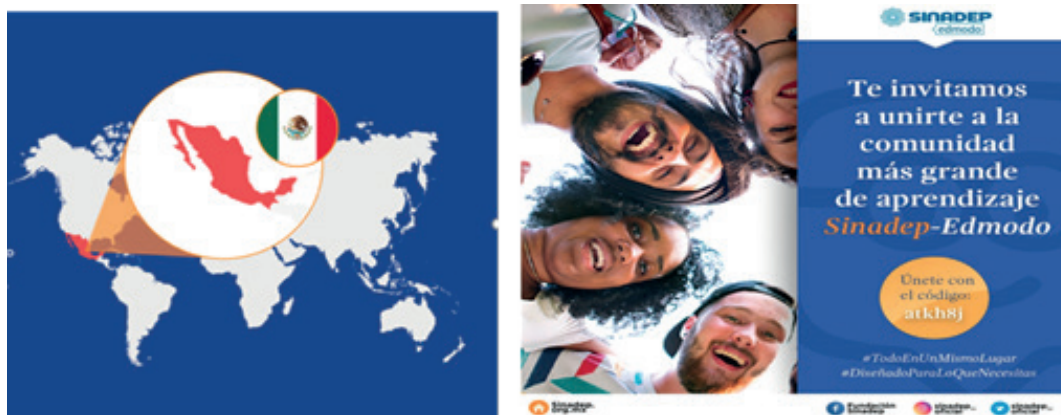
Figura 6. Infografía de la comunidad más grande