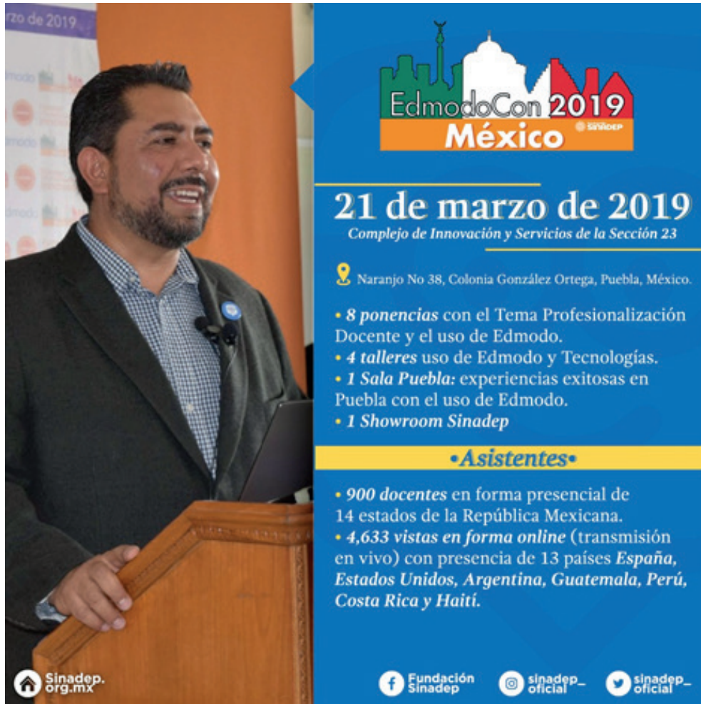
Figura 12. Edmodocon México 2019

En la figura 12 se muestra la estadística del Edmodocon 2019: