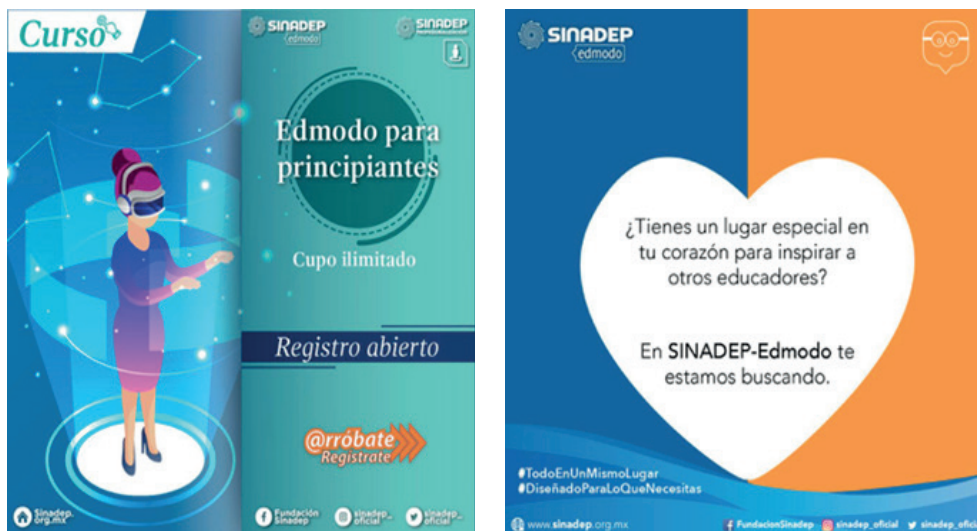
Figura 1 y 2 Infografías de sensibilización.

En junio de 2017 contábamos con 11,000 profesores, se comenzó una campaña de sensibilización a través de redes sociales y correo electrónico (figura 1 y 2), para que se conociera el uso y funcionamiento de Sinadep–Edmodo.