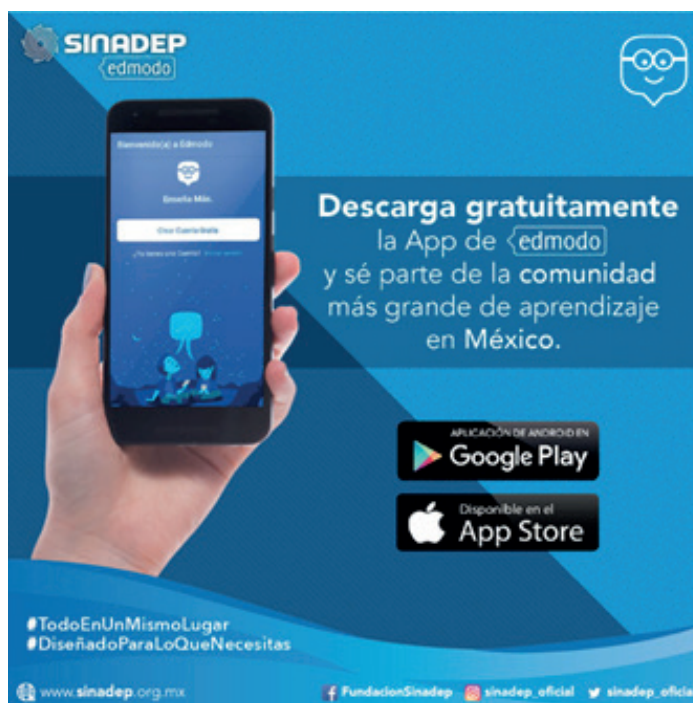
Figura 7. Infografía de la app de Edmodo

Sinadep-Edmodo poco a poco se fue constituyendo como un parteaguas en la forma como se enseña en México, para ello necesitábamos que el aprendizaje pudiera ser llevado en los móviles y se creó la aplicación (figura 7), con ello se estableció una oportunidad más para estar conectados en las comunidades de aprendizaje y llevar la plataforma Sinadep-Edmodo en la palma de nuestras manos.