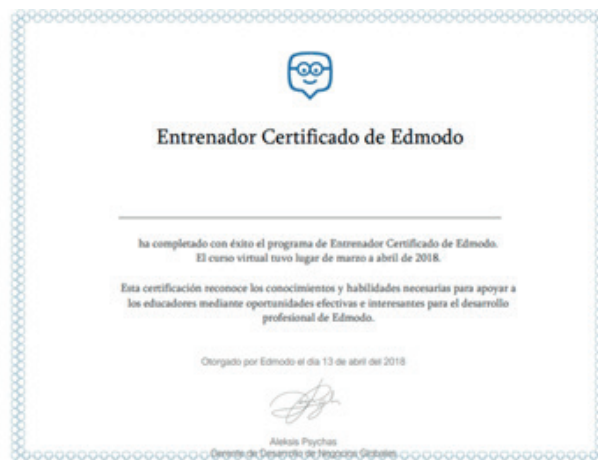
Figura 10. Certificado Entrenador Edmodo

Una vez que los profesores se profesionalizaron en el uso de Edmodo, se creó una Certificación (figura 10) para que los profesores más experimentados pudieran capacitar a otros docentes, teniendo 60 entrenadores con la certificación Internacional por Edmodo.