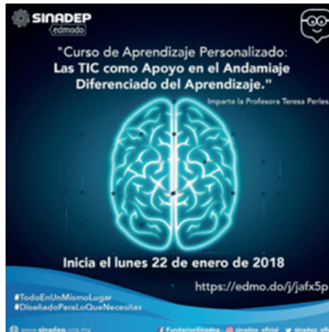
Figura 11. Infografía Curso

Y se ofertó el “Curso de Aprendizaje Personalizado: Las TIC como apoyo en el Andamiaje Diferenciado del Aprendizaje” (figura 11) a más de 500 docentes.