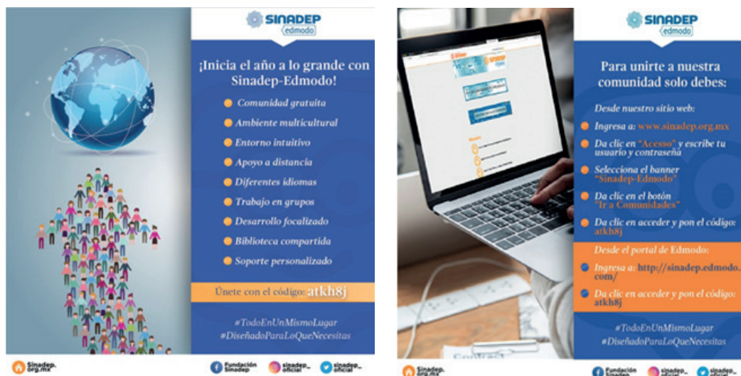
Figura 3 y 4 Infografías de sensibilización.

Entre 2017 y 2018 se dieron a conocer 45 comunidades de aprendizaje (figura 3 y 4) donde se abordan diferentes temas de interés educativo, en todos los niveles desde educación preescolar hasta educación superior, espacios donde los docentes se conectan, intercambian ideas y se apoyan de forma colaborativa y comunal.