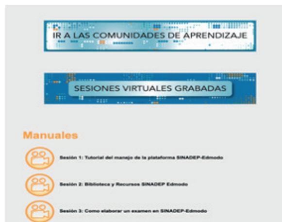
Figura 9. Sesiones grabadas

Si algún docente no pudiera entrar en vivo, tiene la oportunidad de revisar las sesiones en vivo que son grabadas y subidas a la red. (figura 9) https://www.sinadep.org.mx/Portal/edmodo