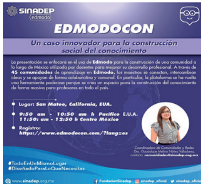
Figura 8. Edmodocon 2018

Año con año desde el 2013 Edmodo realiza su conferencia virtual más grande e importante del mundo el Edmodocon, en San Mateo, California, donde se tuvo la oportunidad de participar con la ponencia “Un caso Innovador pa nstrucción social del conocimiento” (figura 8), siendo elegidos entre más de 500 casos de éxito alrededor ra la co del mundo, considerados ponentes destacados y representantes de México ante el mundo. https://medium.com/edmodo-en-espa%C3%B1ol/ponente-destacada-de-edmodocon-melina-guadalupe-n%C3%BA%C3%B1ez-f40d3370bfe9