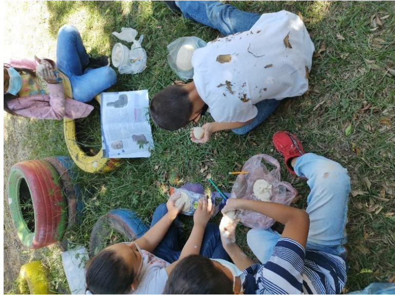
Figura No. 2 Autoría propia.

Al término del proceso de hechura de la masa y el modelaje de las piezas solicitadas, los alumnos mostraron como habían quedado sus esculturas y compararon el trabajo entre ellos, posteriormente se reflexionó sobre el gran trabajo que realizaron los olmecas al esculpir dichas esculturas en piedra y sin contar con herramientas de alta tecnología.