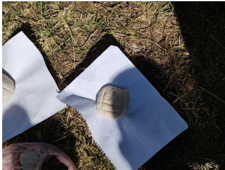
Figura No. 3

Al término del proceso de hechura de la masa y el modelaje de las piezas solicitadas, los alumnos mostraron como habían quedado sus esculturas y compararon el trabajo entre ellos, posteriormente se reflexionó sobre el gran trabajo que realizaron los olmecas al esculpir dichas esculturas en piedra y sin contar con herramientas de alta tecnología.