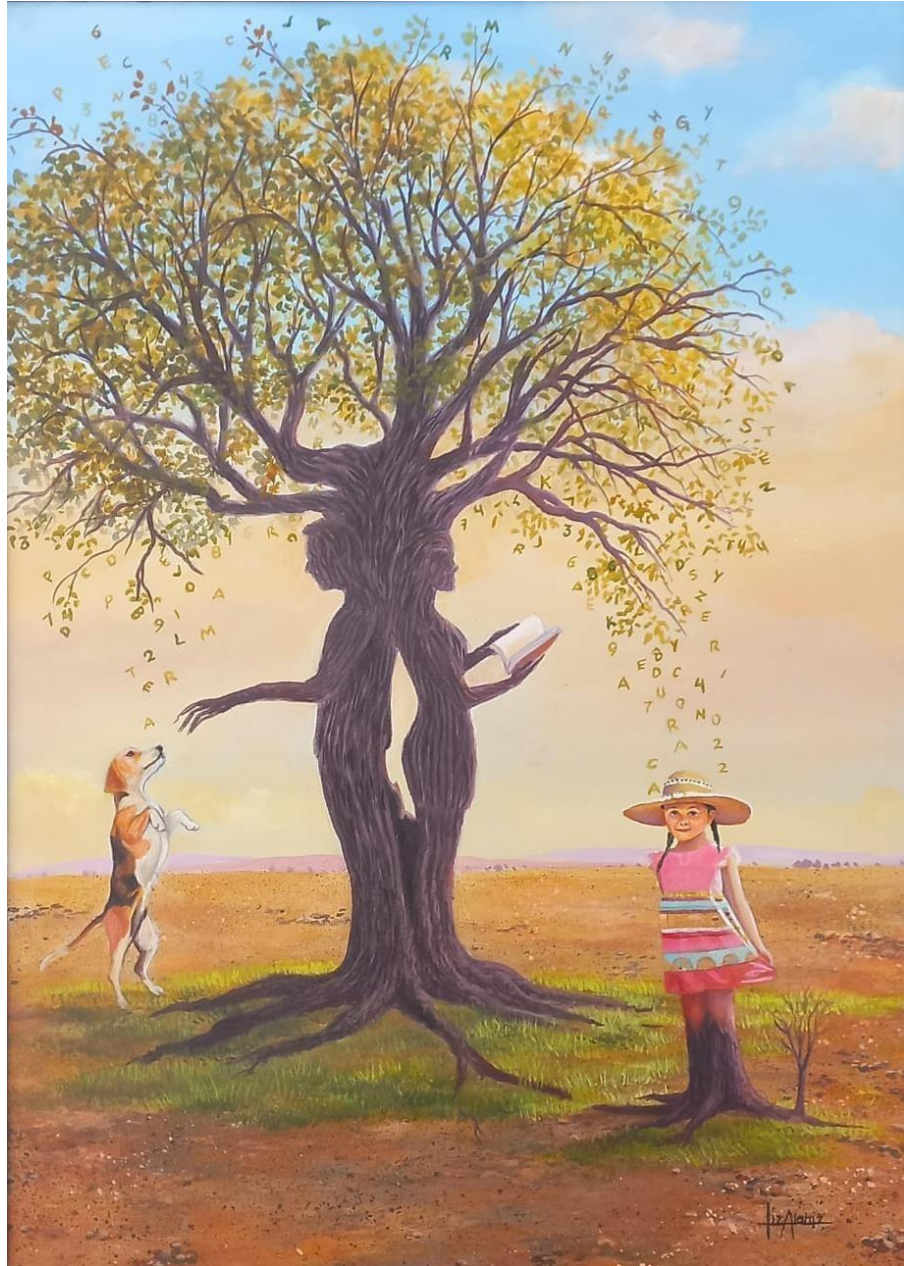
Pintura Autoría propia Alaniz, M. Lizzeth (2022)