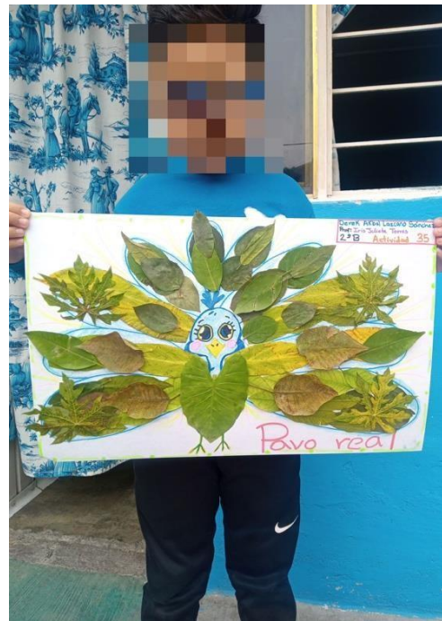
Fig. 8. Actividad: Creación de una obra a partir de hojas de plantas. Torres, I. J. Planeación. Proyecto: Mi animal favorito. (febrero 2021)