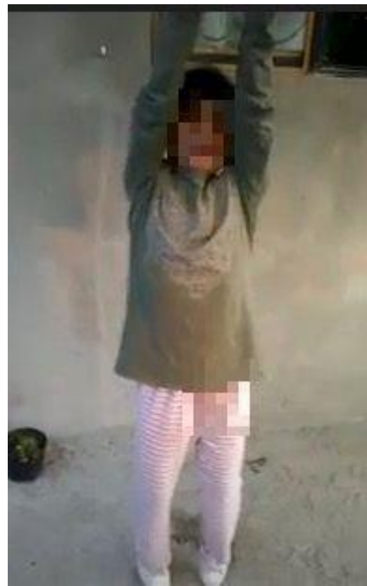
Fig. 6. Actividad: Imitamos animales. Evidencia de video. Torres, I. J. Planeación. Proyecto: Mi animal favorito. (febrero 2021)