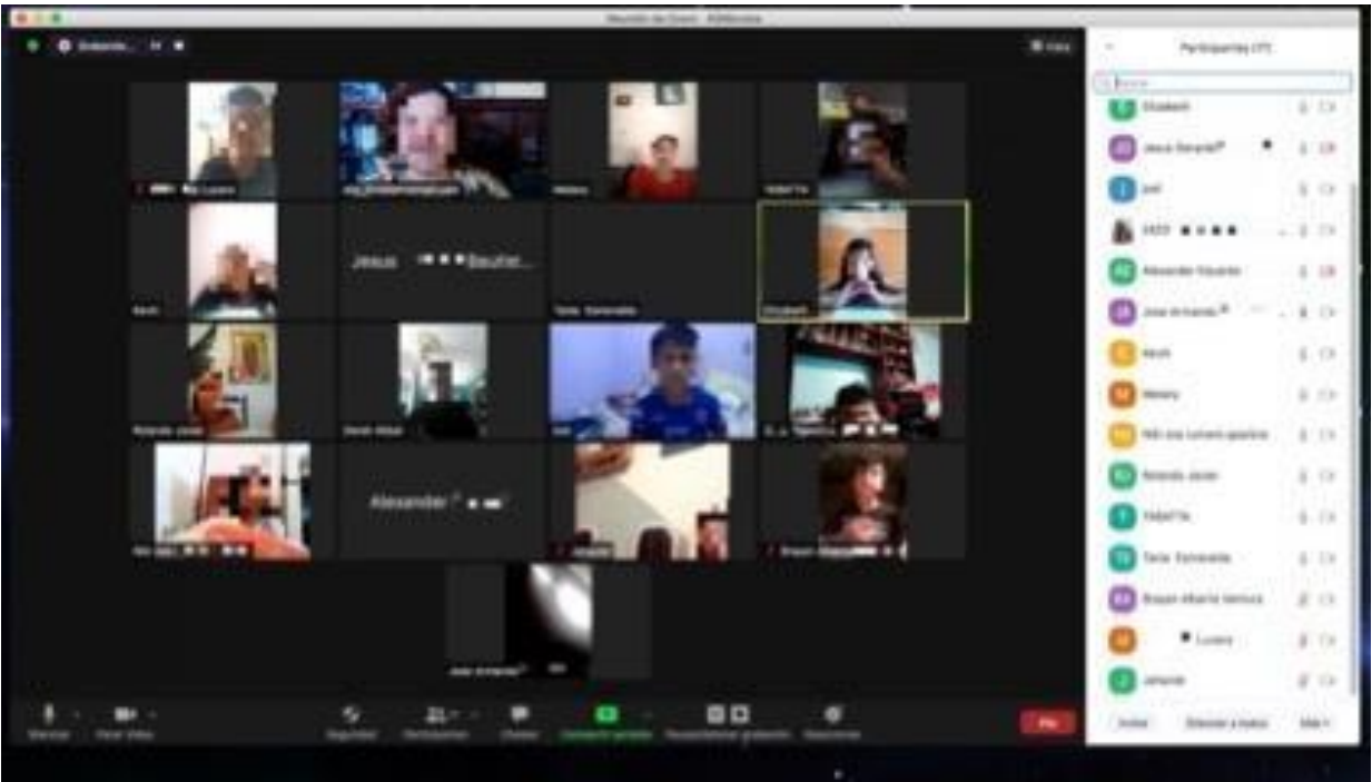
Fig. 9. Clase virtual a través de la plataforma ZOOM. Fecha de reunión 26 de febrero como actividad de cierre y retroalimentación del proyecto. Torres, I. J. Planeación. Proyecto: Mi animal favorito. (febrero 2021)