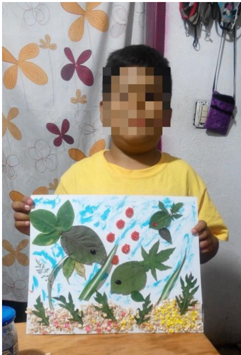
Fig. 7. Actividad: Creación de una obra a partir de hojas de plantas. Torres, I. J. Planeación. Proyecto: Mi animal favorito. (febrero 2021)

EVIDENCIA: Asistencia a la clase virtual de presentación y retroalimentación de trabajos y una fotografía de su trabajo de Artes para subirla al tablero asignado de la plataforma classroom. (Fig. 7 y 8)