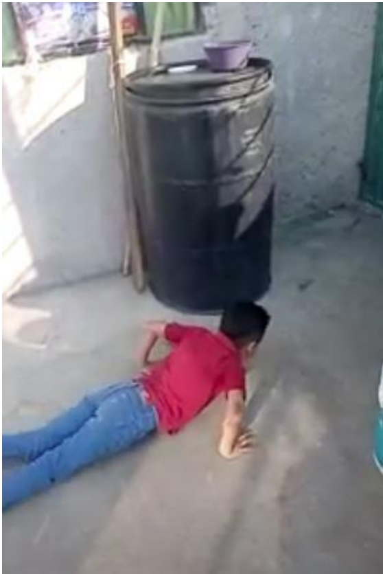
Fig. 5 Actividad: Imitamos animales. Evidencia de video. Torres, I. J. Planeación. Proyecto: Mi animal favorito. (febrero 2021)

EVIDENCIA: Asistencia a la clase virtual y grabación de video para subirlo al tablero asignado de la plataforma classroom.