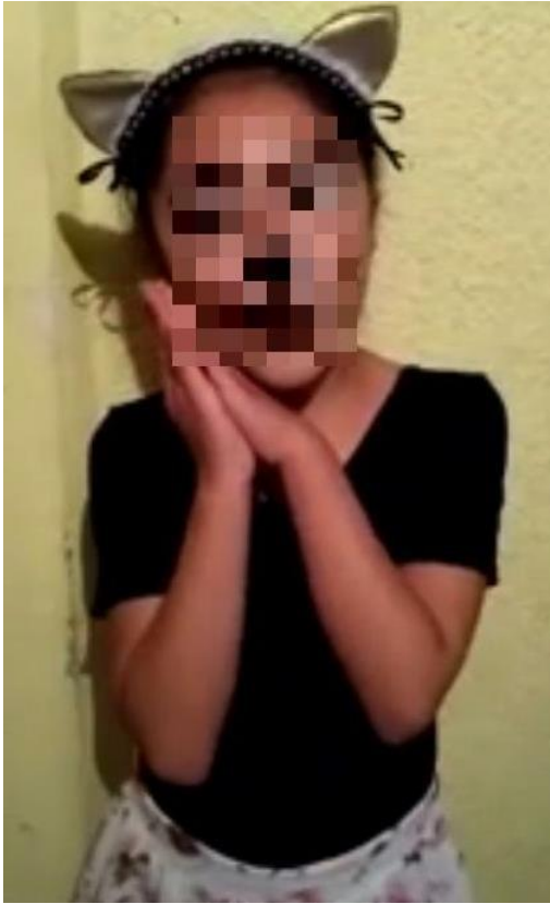
Fig. 11. Evidencia de video de la actividad de cierre del Proyecto: Mi animal favorito. Torres, I. J. Planeación. (febrero 2021)