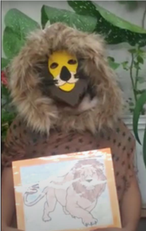
Fig. 10. Evidencia de video de la actividad de cierre del Proyecto: Mi animal favorito. Torres, I. J. Planeación. (febrero 2021)