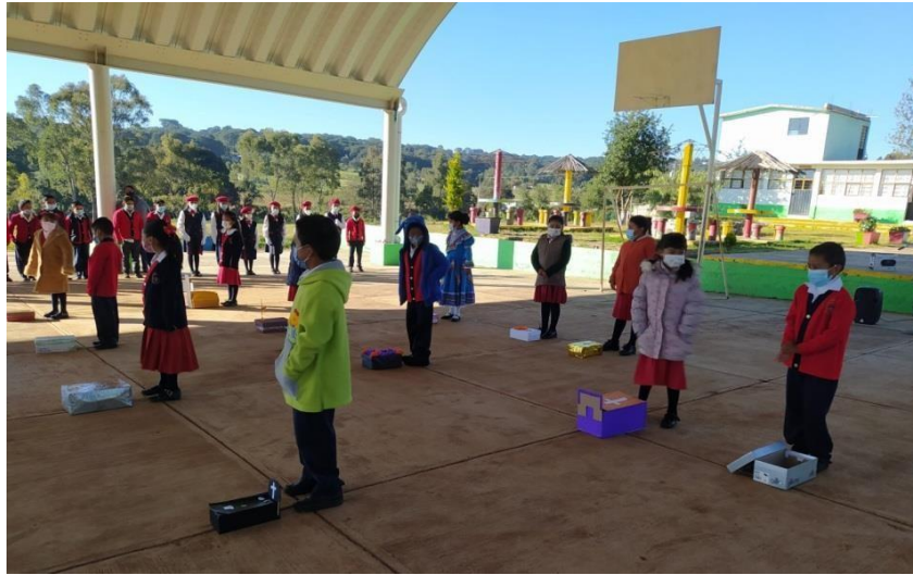
Baile de artes con temática de día de muertos.