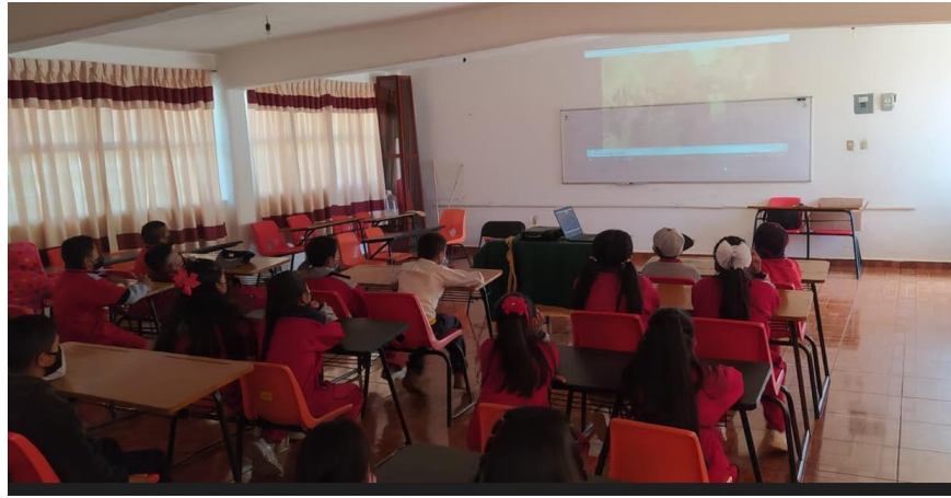
Presentación de diferente formas de celebrar el día de muertos en diferentes regiones.