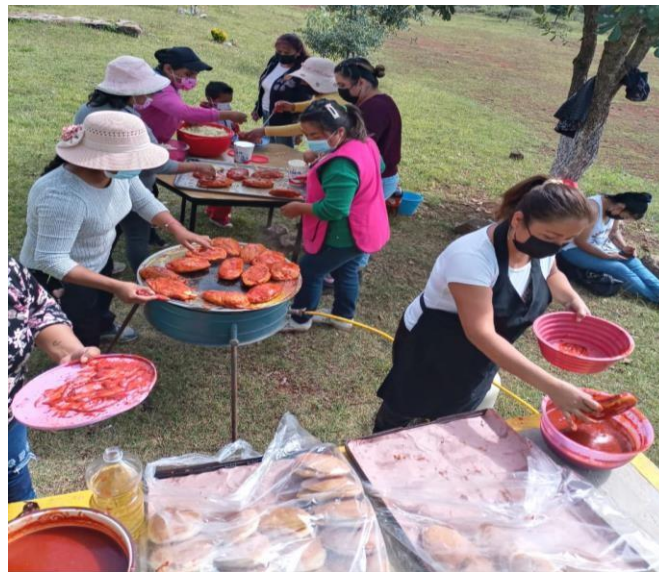
Preparación de alimentos y convivencia