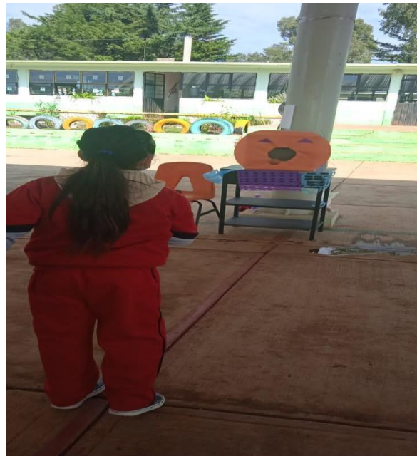
Actividades de educación física