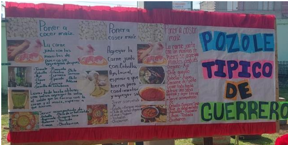
Tríptico ampliado con información de la comida típica del estado de Guerrero, evento Huitzi-fest 02/12/2022.

Semanas previas al evento, cada docente organizó los contenidos que se iban a investigar; asignando a cada alumno junto con el padre de familia un contenido en particular, para después ser revisado de manera minuciosa por el docente clasificando aquella información que se daría a conocer durante el evento, cabe señalar que se realizaron varios borradores de trabajo, corrigiendo ortografía y direccionando el texto o ideas principales con el objetivo de presentar la información de una manera clara.