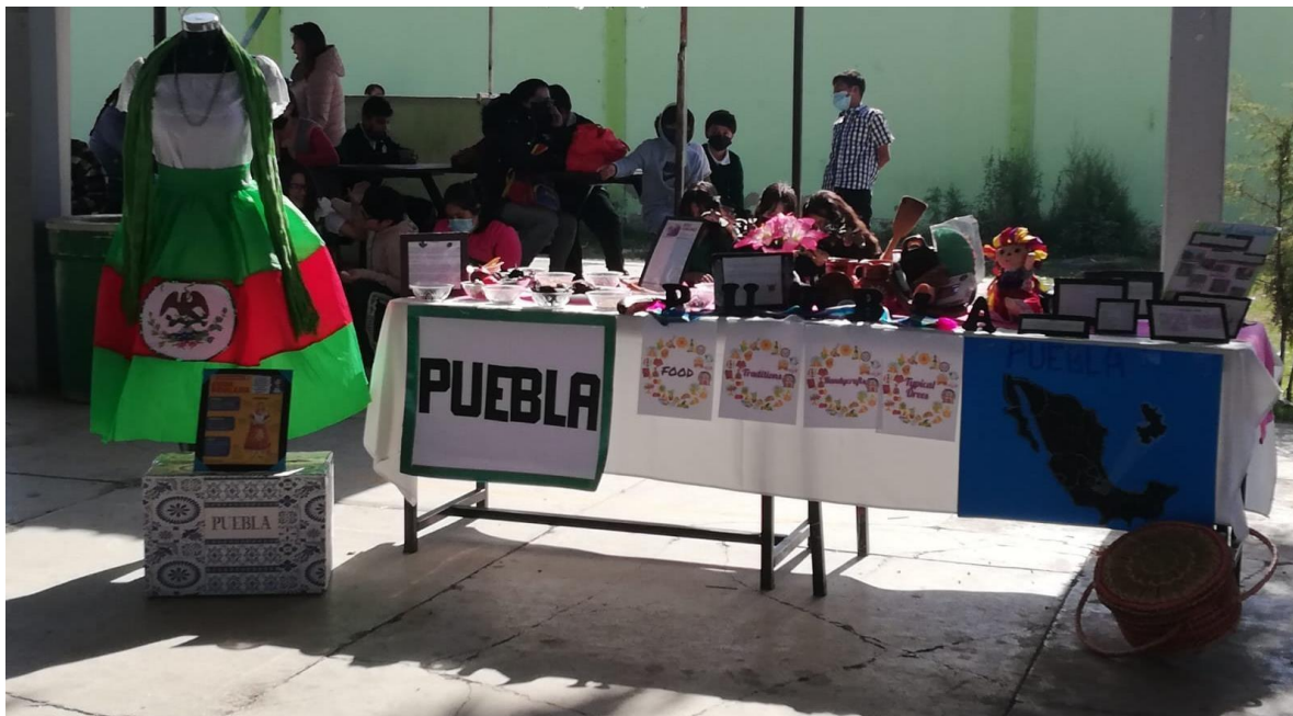
Monografía estatal de Puebla, exhibiendo su traje típico y arte, evento Huitzi-fest 02/12/2022.

información sobre el traje típico y arte del estado de Puebla principalmente se usó y practicó las estrategias de lectura con información relevante, comentando por medio de una lluvia de ideas dicha información, otra de las actividades era desafiar a los estudiantes a buscar información en el texto y extraerla para llenar un organizador gráfico, permitiendo que los estudiantes identificarán y analizarán en grupo la información ubicándola en un diagrama el cual es una forma gráfica para representar información; permitiendo resumir y organizar temas, subtemas y conceptos, reconociendo su utilidad e identificando la información más relevante para elaborarlo, presentándolo en la monografía estatal del festival.