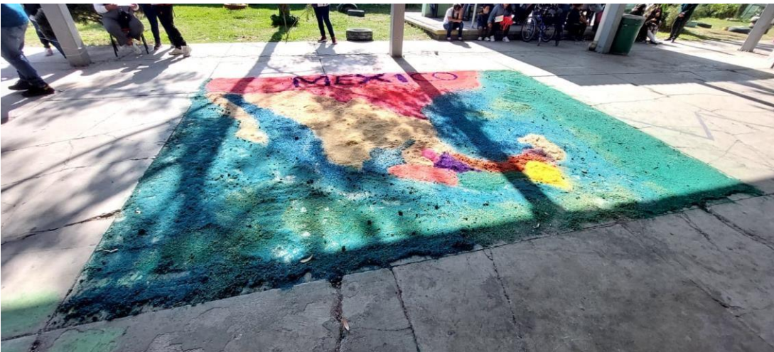
Tapete de aserrín representando el mapa de la República Mexicana, evento Huitzi-fest 02/12/2022.

Como resultado del análisis y revisión de las áreas de oportunidad detectadas, cada grupo trabajo un tema específico teniendo como tema central un estado de la República Mexicana. Los estados con los que se trabajó fueron: El estado de Oaxaca, Puebla, Tlaxcala, Campeche, Veracruz, Chiapas, Michoacán y Guerrero fueron estudiados por los alumnos y alumnas de la escuela Primaria Huitzilopochtli, ellos nos dieron a conocer por medio de las actividades académicas diarias las tradiciones, costumbres, artesanías, platillos típicos, etc. de cada estado. Como primera actividad se diseñó un mapa geográfico de la República Mexicana en donde cada estado se representó con aserrín de diferente color posteriormente se colocó un stand por estado.