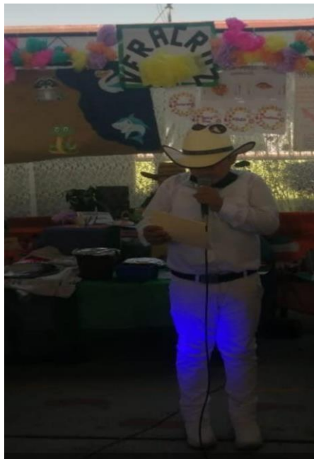
Poema "A mi Veracruz" recitado por alumno de 4° "A", evento Huitzi-fest 02/12/2022.

Trabajamos con varios poemas con la finalidad de reconocer las características que tienen los poemas, marcaban las estrofas, los versos, las rimas, clasificaron las sílabas asonantes y consonantes, identificaron las sílabas tónicas. Al poema que le dimos más peso es el de cada estado, por ejemplo, al grupo de cuarto el poema lleva como título A mi Veracruz , donde lo leímos con la musicalidad y ritmo que tiene, también identificamos sus partes, poniendo en práctica lo aprendido. La comunidad de la escuela que fue invitada escucho con atención cuando los poemas fueron recitados.