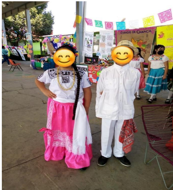
Traje típico de Campeche estudiantes de 5° "B" evento Huitzi-fest 02/12/2022.

Fue un trabajo en equipo que rindió frutos la mayoría de los padres de familia participo con interés y entusiasmo, se expuso un trabajo muy completo.