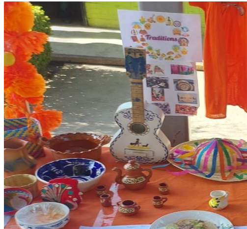
Cartel para identificar la similitud que puede haber entre el inglés y español, evento Huitzi-fest 02/12/2022.

Para empezar a dar a conocer el trabajo que se ha estado llevando en la institución y que lo puedan trabajar y relacionar fuera de la escuela.