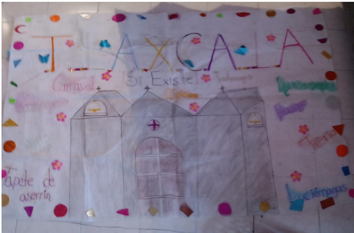
Feria de Tlaxcala, costumbres y tradiciones, evento Huitzi-fest 02/12/2022.

,se pegan en el pizarrón los anuncios que trajeron para observar de qué manera están estructurados y realizar la comparación con lo que se trabajó , cada alumno deberá de realizar su anuncio , al término del mismo se pegaran en el pizarrón y se analizan, les daremos lectura buscaremos su características los alumnos observan si están completos , elegimos el que cumple con los requisitos para ser un anuncio y se dan a la tarea de realizarlo para mostrarlo en la comunidad. Para realizarlo se forman equipos y cada uno le tocara anotar el elemento del anuncio, como material se usarán dos metros de papel blanco, marcadores y dibujos que podrán pasar, sin dejar de revisar la caligrafía y ortografía.