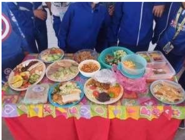
Imagen Autoría Propia

Nota: la figura muestra los platillos de menús saludables que los equipos explicaron ante el grupo, cada uno de ellos debía ser equilibrado como saludable.