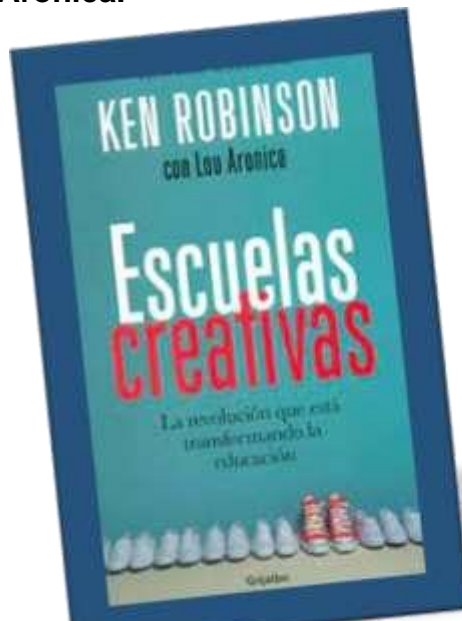
Libro "Escuelas creativas la revolución que está transformando la educación, 2015 Ken Robinson y Lou Aronica

Escuelas creativas la revolución que está transformando la educación, 2015 Ken Robinson y Lou Aronica.