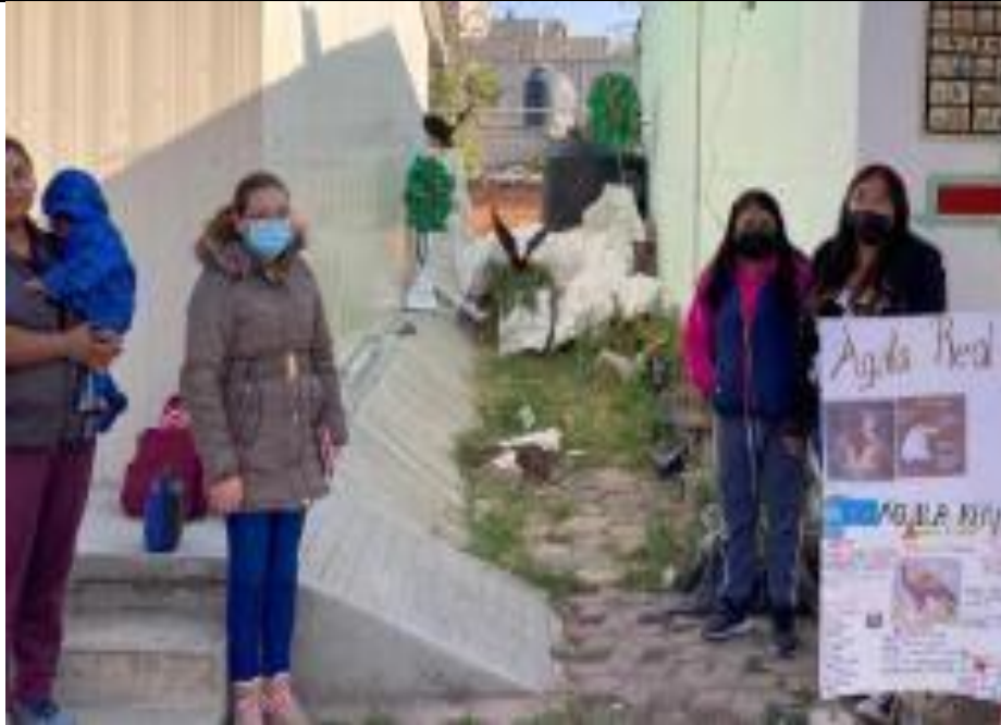
Fotografía 3. Explicación de los padres de familia al público.