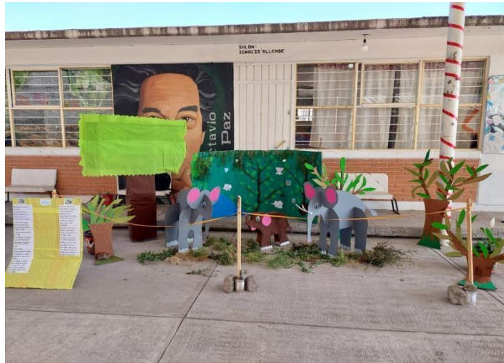
Fotografía 10. Los elefantes en su hábitat.