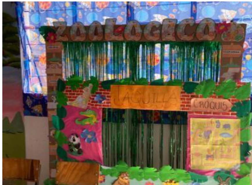
Fotografía 2. Taquilla del zoológico.