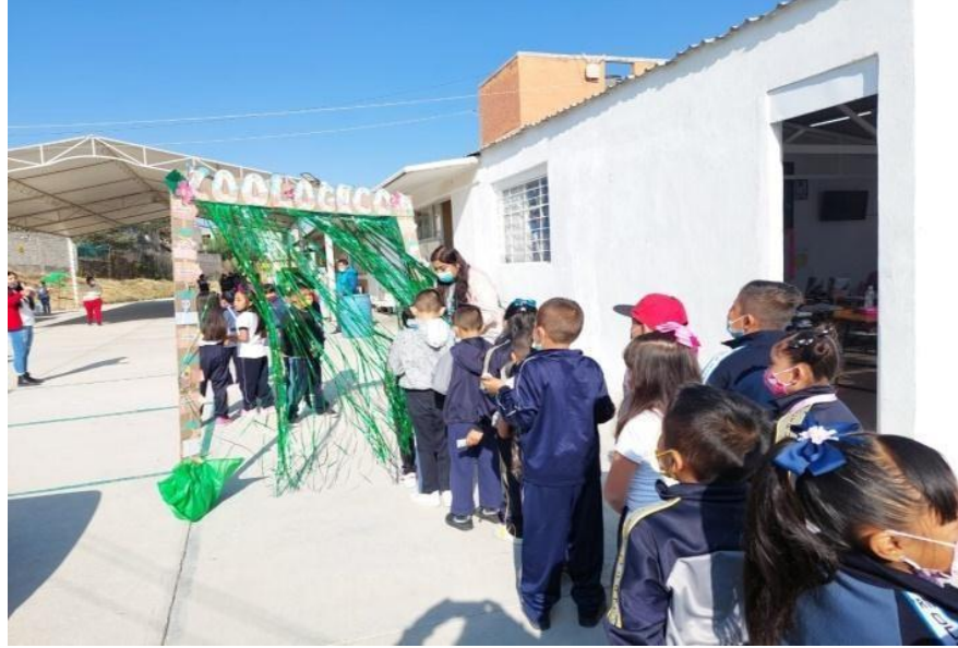
Fotografía 1. Niños formados para ingresar al zoológico.