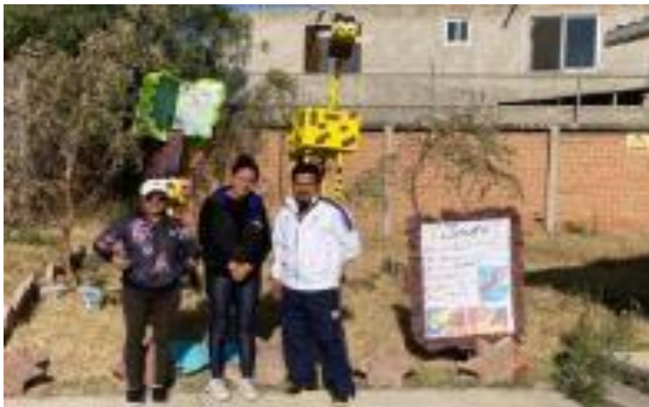
Fotografía 4. Visitantes al zoológico.