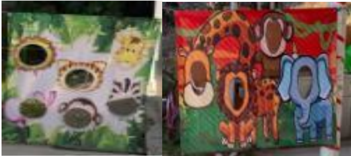
Fotografía 5 y 6 Pantalla para toma de fotografías..