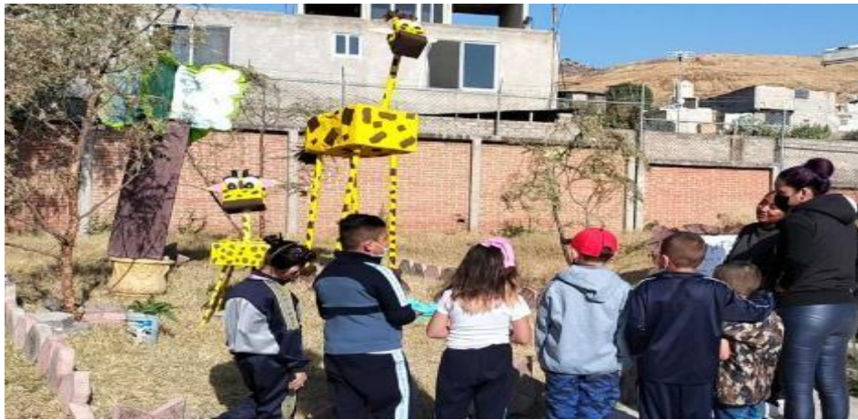
Fotografía 7. Alumnos en el recorrido por el zoológico acompañados de padres de familia.