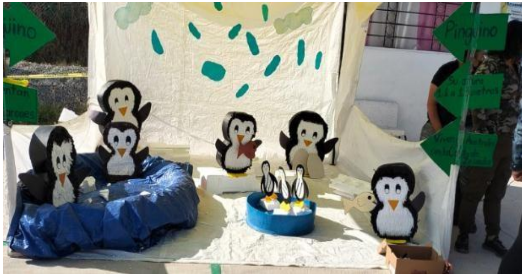
Fotografía 7. Sección de aves marinas, no voladoras..