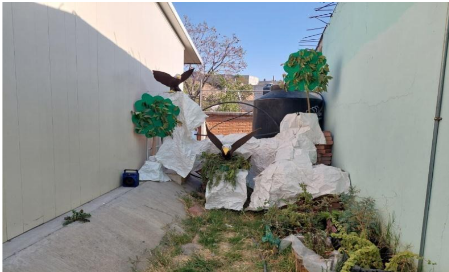
Fotografía 8. Sección de águilas.