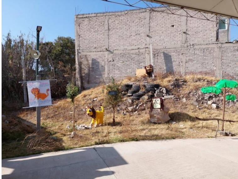
Fotografía 9. Felinos salvajes.