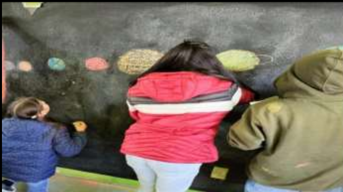
Imagen 2. Alumnos representando el universo.