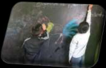
Imagen 3. Alumnos Exponiendo