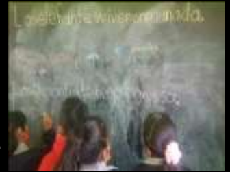
Imagen 1. Los alumnos expresan sus ideas.

Desarrollar en los alumnos competencias que les permitan adquirir aprendizajes que les ayuden a dar respuesta a las necesidades académicas y sociales, transitando hacia una educación inclusiva .