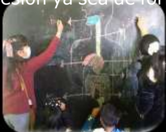
Imagen 4. Esquema del cuerpo humano.

Plasmear su interpretación de lo aprendido del tema trabajado en la sesión ya sea de forma individual o colaborativa.