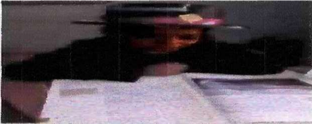
Imagen 1. Alumna portando el sombrero lector y realizando su participación