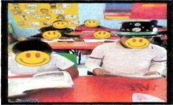
Imagen 3. Alumnas y alumnos leyendo y portando el sombrero lector