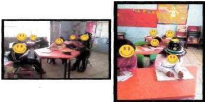
Imagen 4. Alumnas y alumnos participando individualmente y en equipos