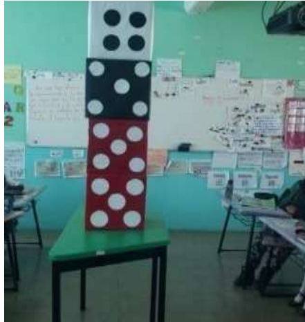
Imagen 2. Estrategia juego de dados.

Se mantuvo la participación activa de la alumna en las actividades escolares, para el logro de sus aprendizajes