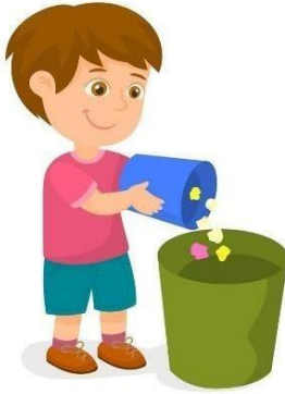
Imagen 6. Niño depositando basura en un contenedor