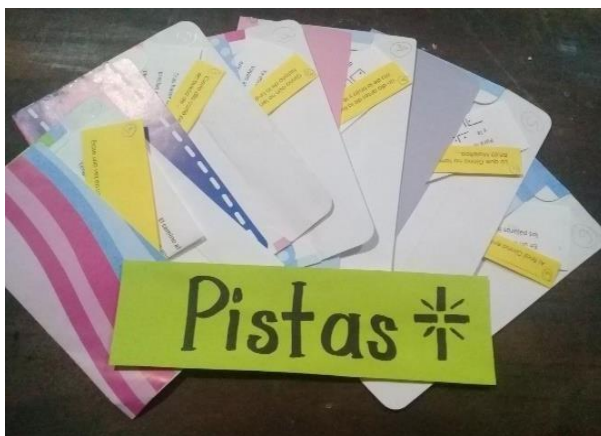
Imagen 1. Villafranca H. (2022), Pistas utilizadas, colocadas dentro de los sobres.

Algunas sugerencias que se pueden utilizar como pistas son las siguientes: