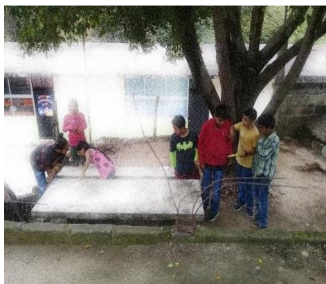
Imagen 5. Villafranca H. (2022). Los alumnos buscan una pista debajo de una mesa de cemento. Evidencia propia

Después de haber leído un libro fantástico, cada vez más cerca estamos. Bajo una mesa de cemento otra pista nos está esperando.