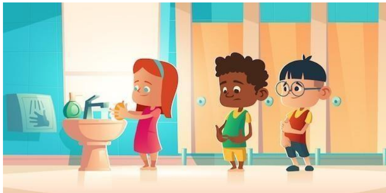
Imagen 3. Niños lavándose las manos en el baño de la escuela, wc.

Tras hacer deporte debemos asearnos, para ello el lugar preciso es el baño. Abran bien los ojos, miren alrededor, la siguiente pista tomarán antes de ir al salón.