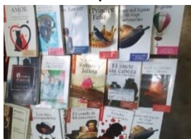
Ilustración 2. Libros de nivel 2

Atendiendo al nivel e intereses en lectura, se le presentará a los alumnos los libros correspondientes con la finalidad de que ellos tengan un primer acercamiento, así mismo, de acuerdo a sus perspectivas tendrán la oportunidad de elegir alguno que a simple vista llame su atención, es importante que el docente puede ir sugiriendo algunos libros, por ello es importante conozca sobre la trama de estos.