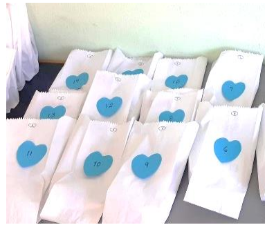
Ilustración 7. El libro sorpresa