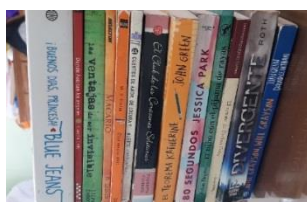
Ilustración 3. Libros de nivel 3