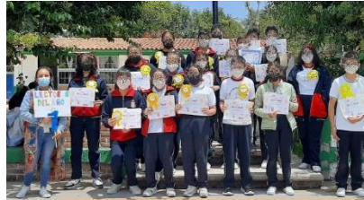
Ilustración 11. Lectores destacados