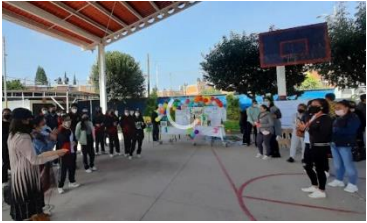
Ilustración 10. Entrega de reconocimientos

El docente puede aprovechar un espacio de las actividades escolares para reconocer a los alumnos que destacaron como lectores durante el ciclo escolar mediante a entrega de diplomas, en la actividad se puede invitar a padres de familia y comunidad educativa con la finalidad de seguir fortaleciendo y motivando a la lectura.