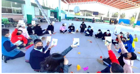
Ilustración 8. ¿Qué libro me toca leer?