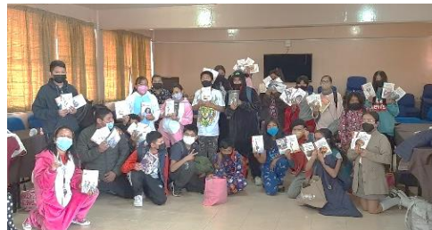
Ilustración 9. Nuestra pijamada lectora