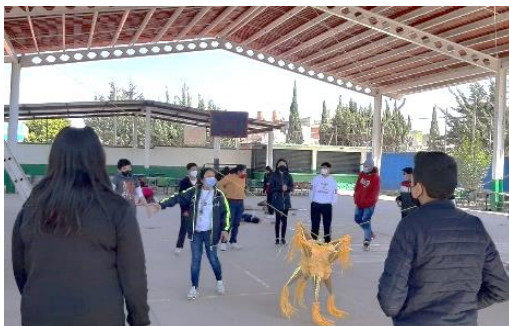
Ilustración 6. Rompemos la piñata