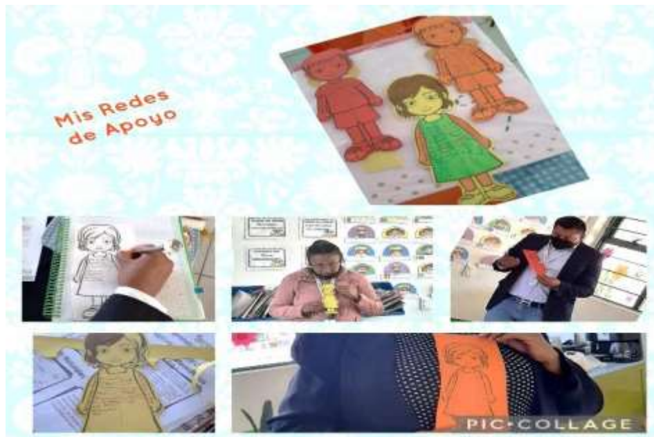
Imagen 9. Mi Red de Apoyo. Después de escribir sus experiencias en la dinámica. Los docentes socializaron sus escritos con el resto del colectivo