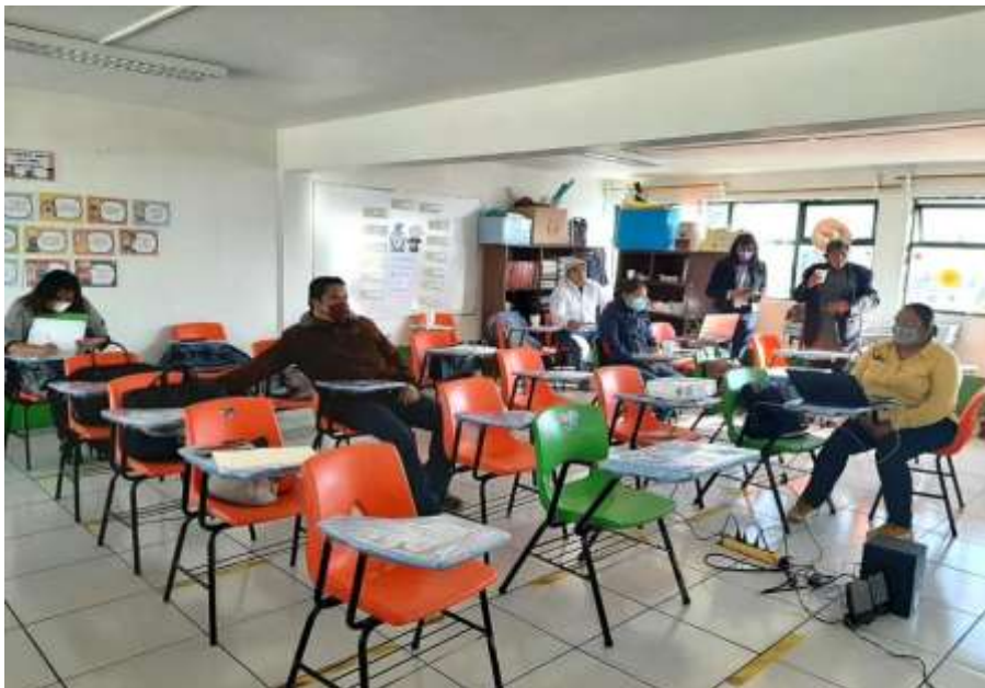
Imagen 1. Lectura Colectiva de la Guía de CTE. El equipo docente, analiza de manera colectiva la presentación de la guía de consejo técnico escolar, para conocer los propósitos que normarán las actividades de la sesión y los productos a obtener, derivados de la jornada.

Los trabajos de esta sesión, comenzaron dando lectura a la presentación, propósitos y productos contenidos en la Guía de Consejo Técnico Escolar, y propuestos para direccionar el desarrollo de esta jornada, tal como se observa en la Imagen 1. Lectura Colectiva de la Guía de CTE.