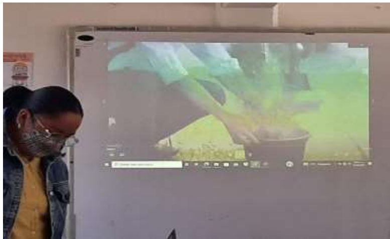
Imagen 5. Vivir para Servir. A partir de la proyección del video “El que no vive para servir, no sirve para servir”, se detonó una mesa de diálogo con aportaciones referentes a la trama del video y experiencias personales para aterrizar en el concepto de “redes de apoyo”