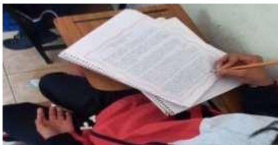
Figura 6. Redacción de textos.