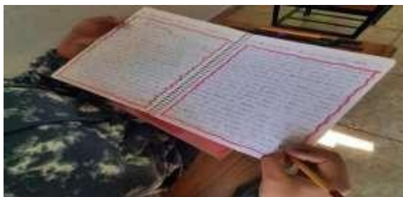
Figura 5. Redacción de cuentos.