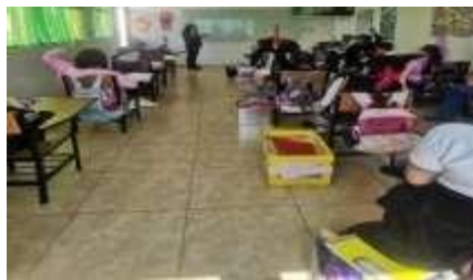
Figura 1. Participación de los alumnos con las preguntas detonadoras.

Se iniciará la clase con preguntas detonadoras para propiciar curiosidad en los alumnos: ¿Te asustan las historias sobre fantasmas, vampiros o muertos vivientes? ¿Cuál es tu monstruo favorito? ¿Un zombi, un hombre lobo? Escuchar, leer y contar historias de misterio y terror puede asustar, pero también es muy entretenido. Si escribieras tu propio cuento de terror, ¿De qué trataría?