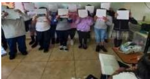
Figura 7. Cuentos escritos por los Alumnos. Autoría propia

Terminadas las correcciones, los alumnos tendrán listo su cuento para poder realizarlo en la computadora y posteriormente leerlos a los alumnos de los otros grados.