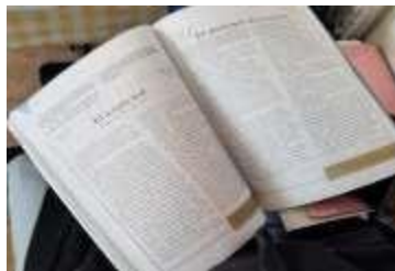
Figura 3. Lectura de diferentes cuentos de misterio y terror.