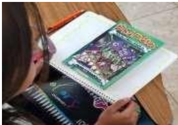
Figura 2. Lectura de diferentes cuentos de misterio y terror. Autoría propia

Una vez contestadas las preguntas de los alumnos observarán distintos libros acerca de misterio y escogerán uno, se comenzará con la lectura de uno y se comentará su contenido, el escenario y la descripción de los personajes.