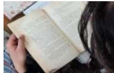
Figura 4. Lectura de diferentes cuentos de misterio y terror.

Se hablará acerca de las características de cómo son los personajes en los cuentos de misterio y terror. Se mostrarán imágenes de dos personajes y los alumnos tendrán que describirlos.