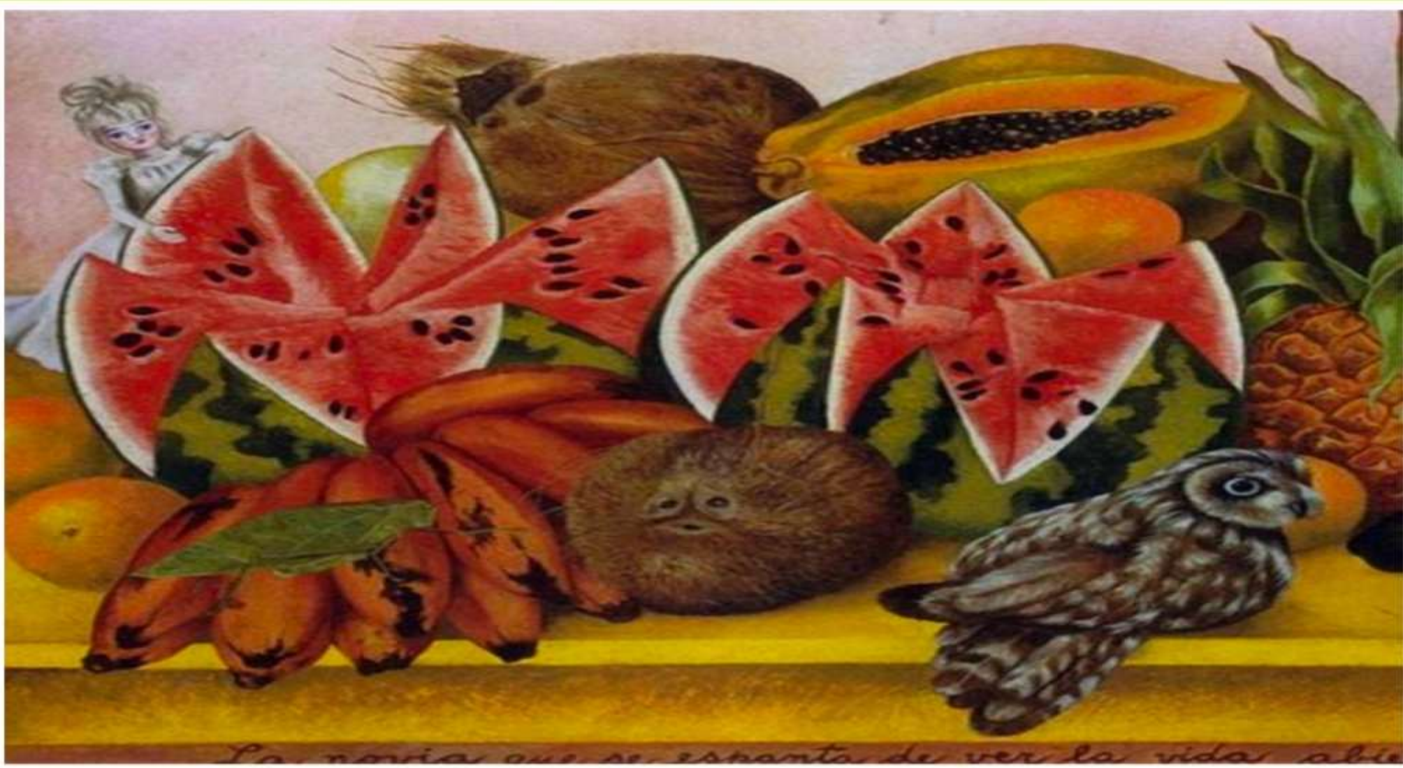
La novia que se espanta de ver la vida abie