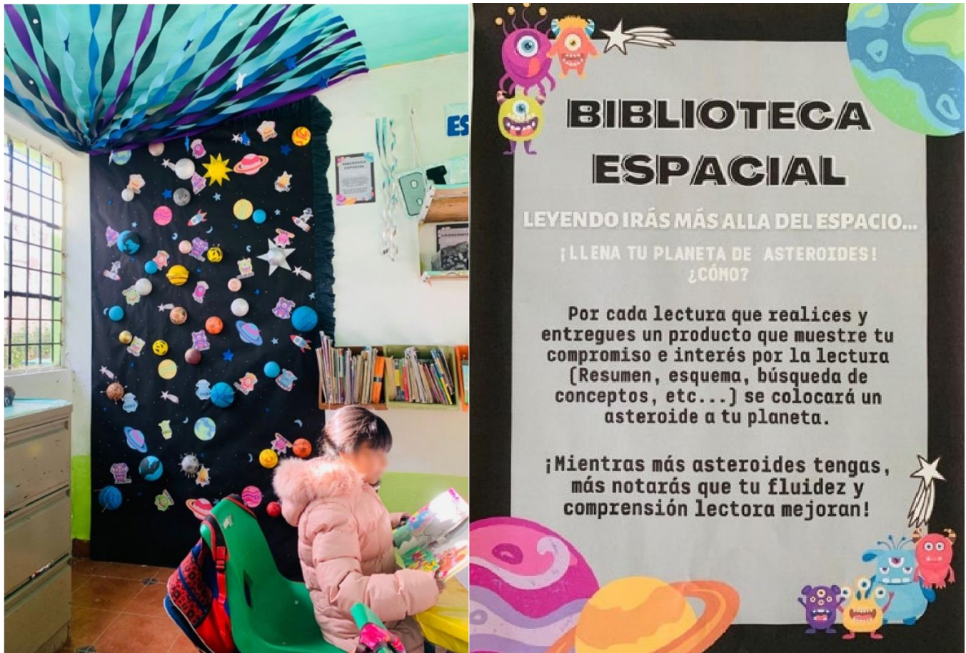
Ilustración 1 Biblioteca de la esquina lectora en el aula