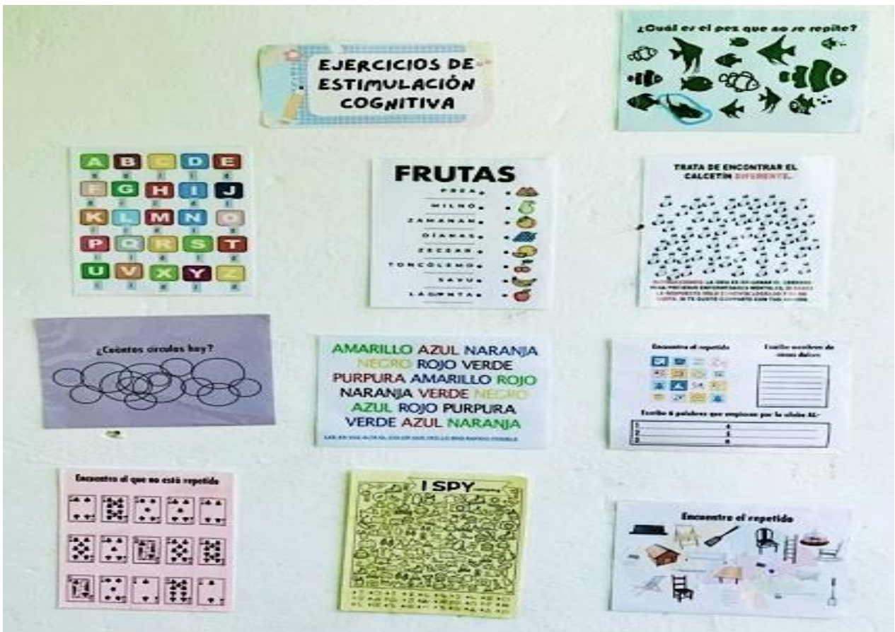
Ilustración 6. Ejercicios de estimulación cognitiva presentes en la esquina lectora