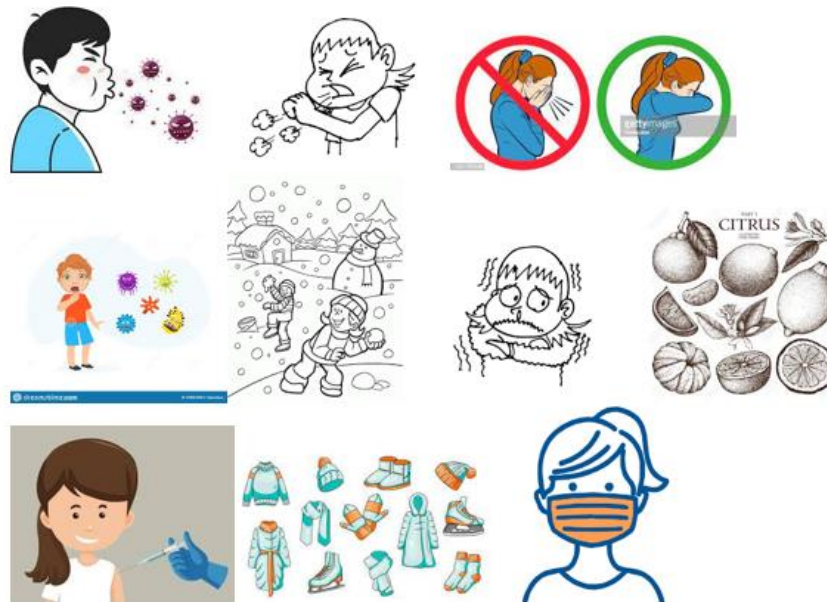
Villavicencio M. 2022, IRAs, figura 1, 4, 9