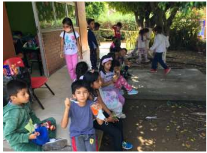
Hora de almuerzo y compartir los alimentos que los alumnos llevaron.