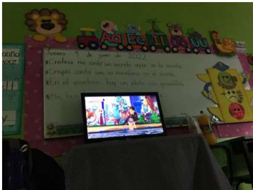
Instalación de materiales físicos y digitales para la reproducción de la película “El Lorax”.