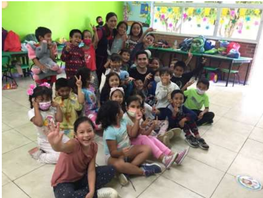
Actividad de cierre: tiempo libre de convivencia.