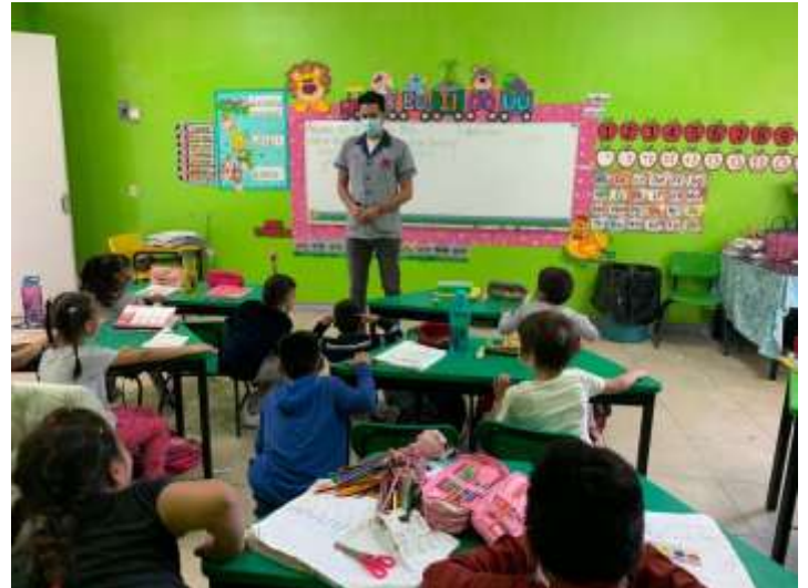
Técnica “enanos y gigantes”