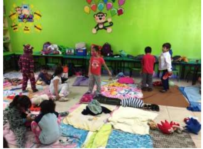
Acomodo y ubicación de los tapetes o cobijas de los estudiantes.