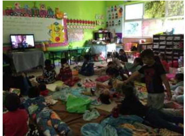
Reproducción de la película “El Lorax”