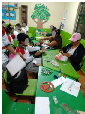
Imagen 5. Elaboración de coronas navideñas