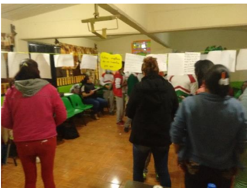
Imagen 3. Participación de padres de familia en una actividad de Formación Cívica y Ética.