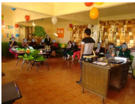
Imagen 6. Presentación de los avances logrados durante el desarrollo de las actividades.