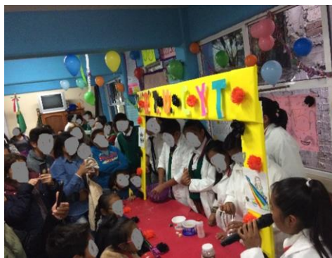
Imagen 4. Desarrollo de la actividad de "Ciencias y Tecnología"