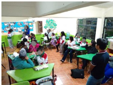
Imagen 2. Elaboración de un collage familiar.