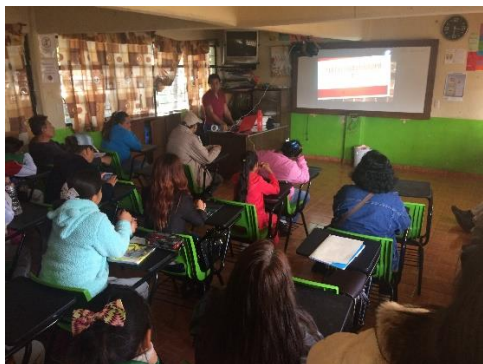
Imagen 1. Presentación de las actividades a los padres de familia.