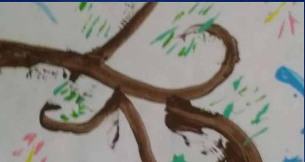
Figura 6: Las plantas son más que adornos o modelos del arte.