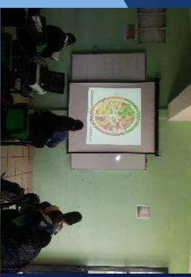
Figura 3: Todos los seres vivos requerimos de energía para realizar actividades.