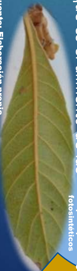
Figura 8: las hojas son los principales órganos fotosintéticos

Las hojas son los principales órganos fotosintéticos, en el envés (parte de abajo) de las hojas se encuentran unos pequeños poros llamadas estomas .