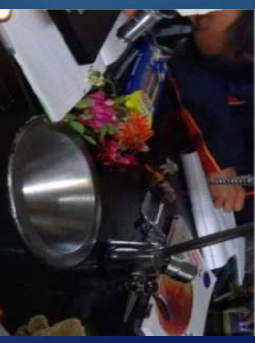
Figura 1: Las plantas fuente de energía primaria.

Representa las transformaciones de la energía en los ecosistemas, en función de la fuente primaria (fotosíntesis) y de las cadenas tróficas.