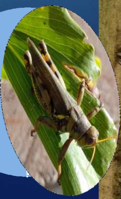
Figura 5: Los organismos productores son la base de la pirámide alimentaria.