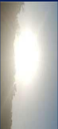
Figura 7: Las plantas reciben la energía del sol.