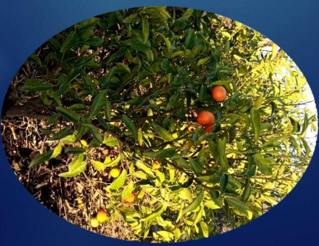
Figura 9: Las plantas contienen energía que transfieren a sus depredadores.

¿Cuál es la importancia de los organismos fotosintéticos en un ecosistema?