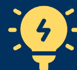
IMAGEN 5:

3. El docente debe impulsar un ambiente de colaboración y generar situaciones de aprendizaje.