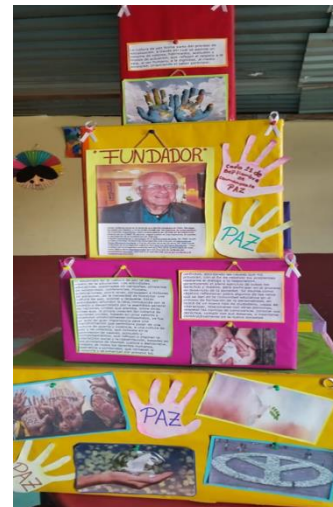
Montaje 1 de museo escolar Sec. Ofic. No 1107 "Miguel Hidalgo"

Creación de cuadros de retratos sobre personajes que hayan defendido la libertad, los derechos, así como la creación de documentos que argumente el tema.