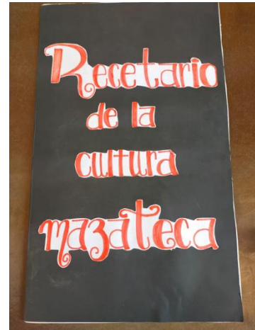
Montaje 2 de museo escolar Sec. Ofic. No 1107 "Miguel Hidalgo"

Cada representante de equipo, será quien realice la exposición de su sección correspondiente.