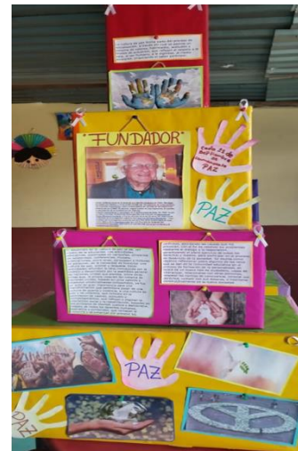
Montaje 1 de museo escolar Sec. Ofic. No 1107 "Miguel Hidalgo"

Creación de cuadros de retratos sobre personajes que hayan defendido la libertad, los derechos, así como la creación de documentos que argumente el tema.