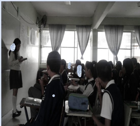
Imagen 1. El diario escolar (Elaboración propia, 2022).

Otra alternativa, es solicitar a las y los estudiantes imágenes con las que se pueda generar un collage y con ello poder “vestir” al diario.