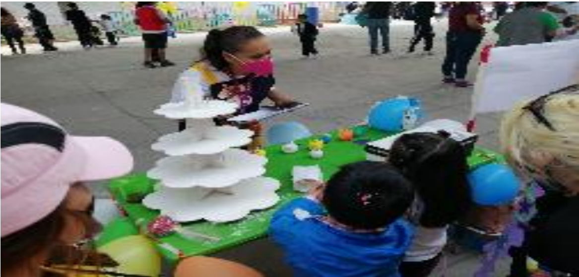
Visitando los stands