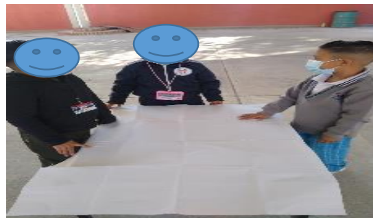
Por equipos tomando acuerdos para elaborar su diseño del producto y realizando el esbozo