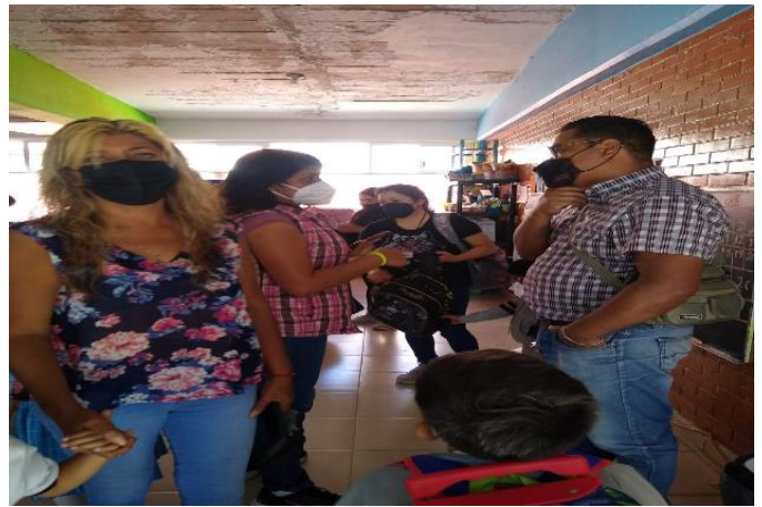
Haciendo partícipes a los padres de familia y brindando acompañamiento.