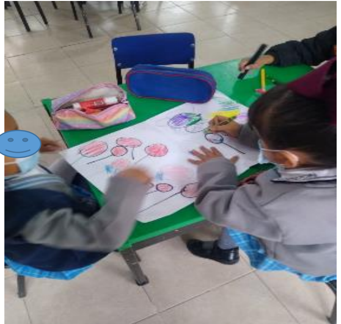
Elaborando el producto.