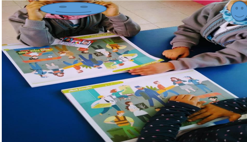
Elaborando la lámina del libro mi Álbum “ Qué hacen”