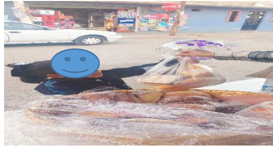
Recorrido por la Localidad