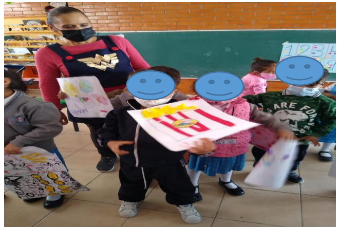
Difusión en la escuela y en la localidad