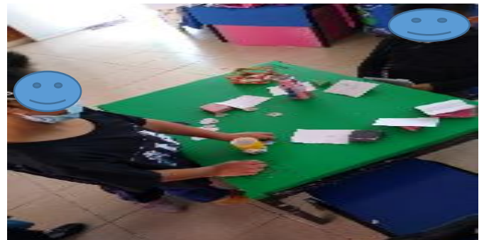
Favoreciendo el uso de las monedas en actividades de compra y venta mediante el juego