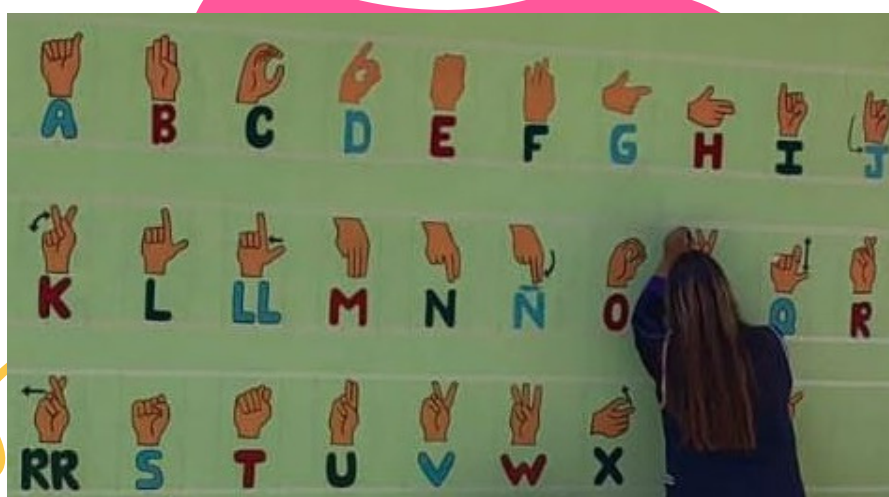
González, C. (Noviembre, 2022), Alfabeto de Lengua de Señas Mexicanas. Nota: Autoría propia

Ante este panorama, las instituciones educativas deben construir y desarrollar estrategias que generen culturas inclusivas, para que los alumnos se vayan apropiando de la necesidad de aprender nuevas formas de comunicación e interacción con quienes son diversos, y transformen entornos hacia una sociedad cada vez mas incluyente mediante el arte