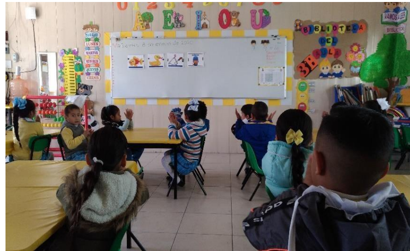
Reconociendo visualmente y practicando con las palmas