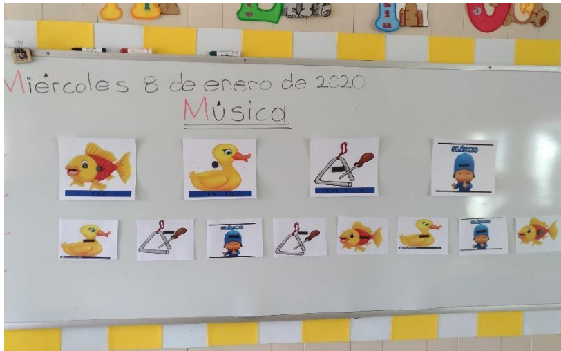
Identificando figura, sonido, palmada