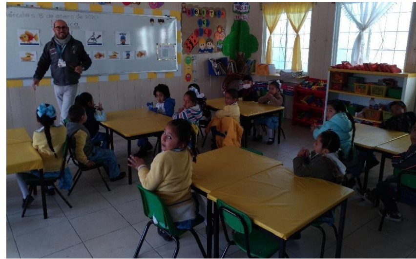
Dictado de figuras incrementando grado de dificultad Reconociendo su práctica en la coevaluación y autoevaluación con las fotografías