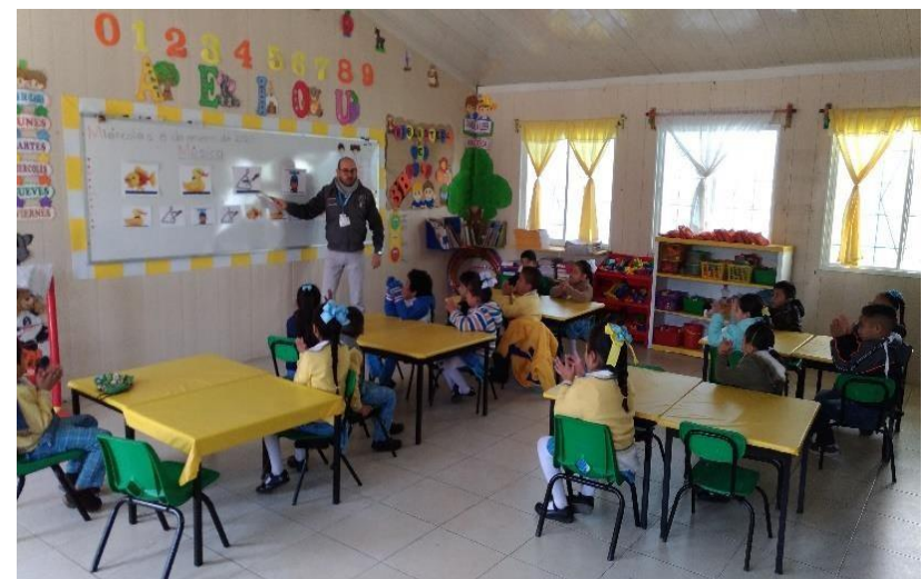
Dictado de figuras