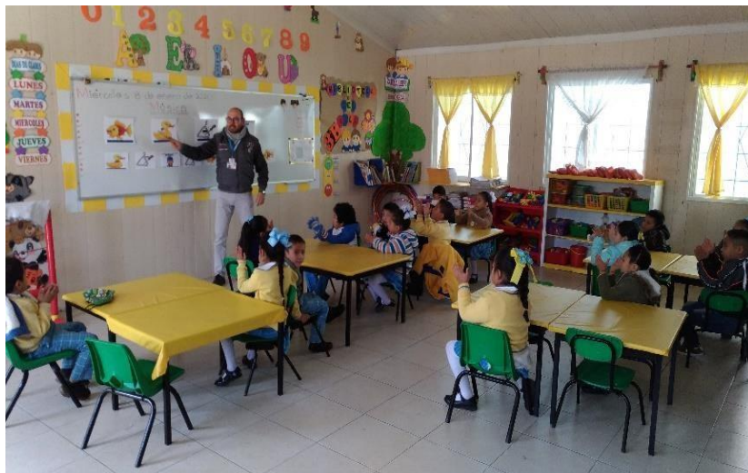
Ejercicio de sonidos, sílabas con palmada y pronunciación