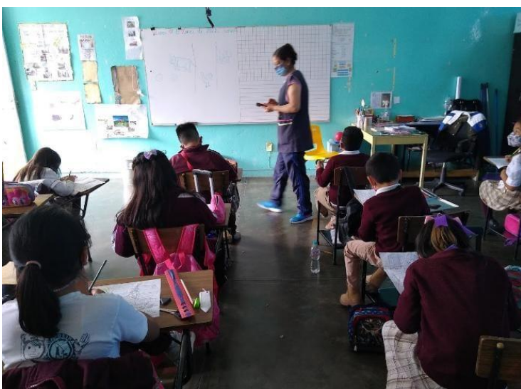
Imagen de la vigilancia del docente en los niños para mantener su modelo

tiempo que impiden elaborar actividades donde fomenten la creatividad del alumno, optando de esta manera por actividades más concretas, más controladas, impidiendo al alumno poder desarrollar su potencial creativo que según distintos autores como Robinson lo tenemos de manera innata desde la niñez. Otro aspecto es simplemente para proporcionar una calificación cuantitativa sin tomar en cuenta si el alumno desarrollo habilidades, capacidades de una forma creativa sin considerar los intereses o propuestas de los alumnos para realizar los distintos ejercicios, o problemáticas que se presenten.