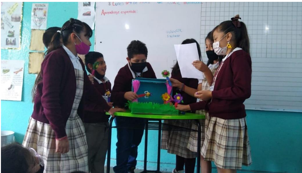
Presentación de teatrino, alumnos de 3° A

La clase de español se dio por terminada hasta ese punto de la elaboración de la historia. Posteriormente les indique que llevaran materiales para elaborar sus personajes como calcetas, papel o cualquier material que prefieran. Al día siguiente se retomó el tema del teatrino, así que les comenté lo siguiente: “chicos, elaborarán sus personajes”. El material que hayan traído lo pueden compartir con su equipo para elaborar las marionetas entre todos”. Algunos alumnos sacaban calcetas; otros niños tela, y algunos otros papeles entre otros materiales. Yo les expliqué que ese material lo tendrían que adaptar para su personaje. Empecé apoyar a cada uno de los alumnos explicándoles cómo es que podría realizar su títere. Conforme les explicaba me logre percatar que ellos esperaban que les diera nuevamente todas las indicaciones así que me dirigí frente a ellos y les comente que iba a tomar en cuenta su imaginación y creatividad en la elaboración de su personaje.