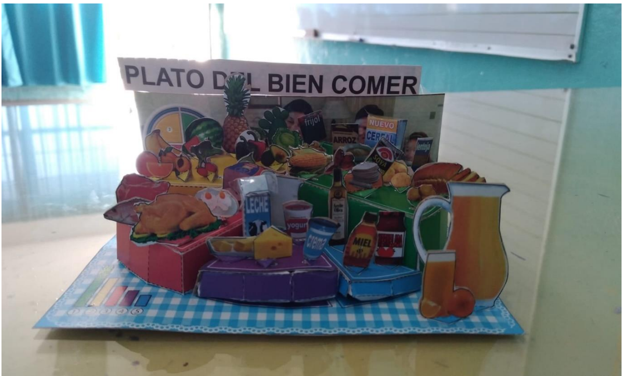
Imagen de la maqueta de la alumna Escarlet

Al iniciar la clase, les presente la maqueta al resto de los alumnos para que observaran los alimentos que integran el plato del bien comer, ellos conforme observaban más y más el plato me preguntaban ¿y que nos aporta este alimento maestra? ¿Este alimento que tiene? Preguntas así frecuentaban mucho. Al término de la clase les indique que me otorgaran sus libretas para revisarles su trabajo y la maestra se me acercó y me preguntó de quien era la maqueta, yo le mencioné que era de la alumna Escarlet, que lo quiso traer igual de esta manera.