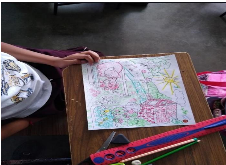
Diseño de actividades de los docentes para fomentar la creatividad

Lo que llama la atención de este pequeño extracto de la entrevista es donde el docente relaciona el hecho de terminar con el programa, con el brindarles anexos 18 que indican solamente el seguir modelos sin permitirle al alumno experimentar para encontrar diversas soluciones.