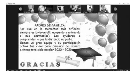
Figura 6. Ejemplo del agradecimiento a los padres de familia al concluir el ciclo escolar (2020-2021)

Al final del ciclo escolar tuvimos nuestra ceremonia de clausura tanto los padres de familia como los alumnos se vistieron de gala para recibir sus reconocimientos de manera virtual, se les otorgo un agradecimiento a todos por integrarse en las actividades educativas.