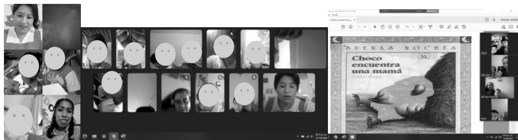
Figura 5. Primeras fotos tomadas para el pase de asistencia utilizando la video llamada de la aplicación de WhatsApp, Meet y zoom para tener contacto con los alumnos.