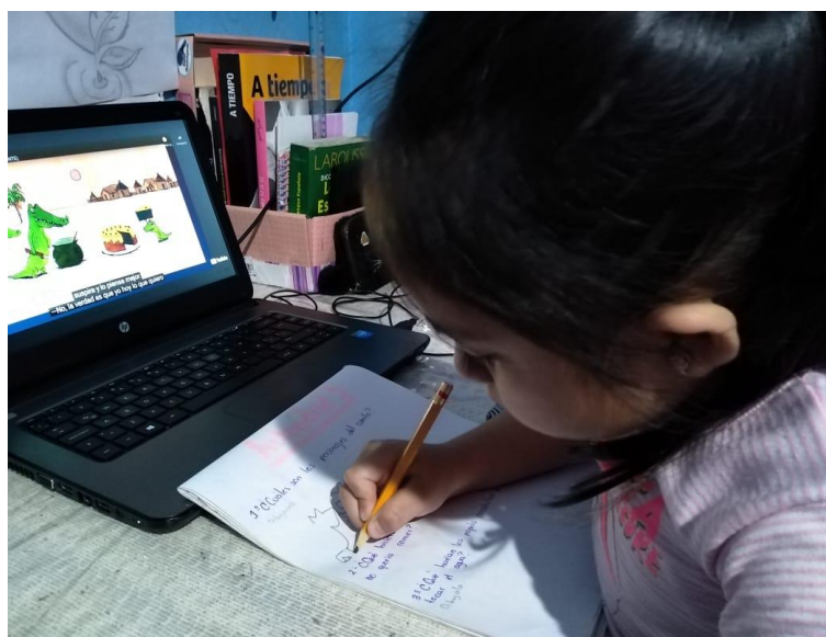
Figura 2. Alumna de tercer grado, recibiendo actividades por medio de la tecnología (mayo 2021)

Se han seguido trabajando los Campos de Formación Continua, así como las Áreas de Desarrollo Personal y Social, asumiendo el compromiso que como docentes tenemos en las manos, motivando a los alumnos a desarrollarse plenamente, para seguir teniendo la capacidad de seguir aprendiendo, incluso ante este difícil momento histórico en el que se está viviendo.