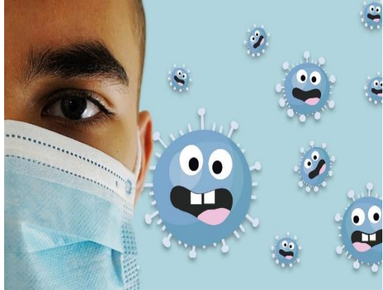
Figura 1. Imagen animada del coronavirus Fuente. SOS Pandemia mundial ¿Y ahora cómo me cuido del Coronavirus?

Los alumnos y alumnas del Jardín de Niños “Laura Mendez de Cuenca”, turno Vespertino, ubicado en una zona urbana, en el municipio de Chimalhuacán Estado de México, asisten de forma presencial a las aulas para cursar el ciclo escolar 2020 - 2021. Socializan entre sus iguales, con la docente así como demás actores que se encuentran dentro y fuera del edificio escolar.