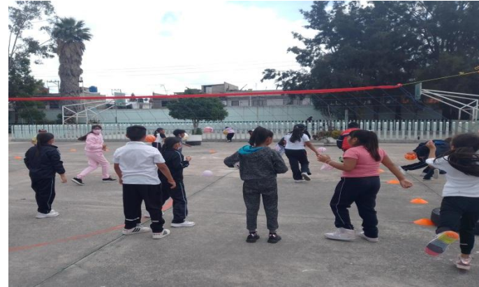
Alumnos de 5° juegos modificados cachibol, donde el objetivo es evitar que la pelota caiga de su lado atrapándola.

escolares y la concientización pláticas con los alumnos es conforme se va dando.