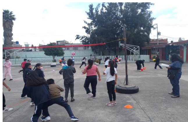
Alumnos de 5° realizando juegos modificados, donde pasan la pelota a al otro lado y evitan que las pelotas al caer de su lado los toque

El docente debe ser capaz de adecuarse al espacio y a los materiales con los que cuenta ya que por diferentes motivos en ocasiones los alumnos no cumplen con el material por lo cual exige al docente ser flexible y creativo a la vez, sin perder los propósitos y aprendizajes de la clase.