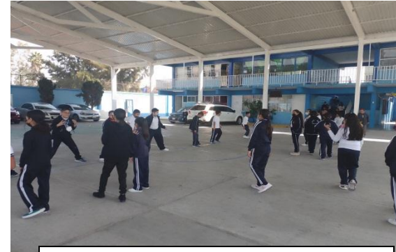
Alumnos de 6° Juego modificado basquetbol modificado los alumnos se ponían de acuerdo quienes defendían y quienes anotaban ya que se tenían que asignar roles de juego.

diálogo, estimulará el pensamiento divergente en el aula potenciando la crítica curricular y social (Tinning, 1992)