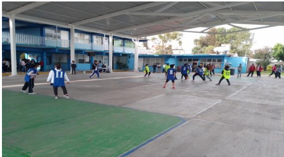
Alumnos de 6° juego modificado futbol modificado, se cambiaban reglas del futbol hasta introducir las reglas básicas del futbol.

El identificar cuáles son sus fortalezas y debilidades propias y de sus compañeros el platicar y tomar acuerdos para buscar un fin común.