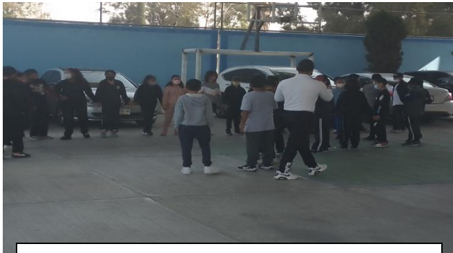
Alumnos de 6° explicando la actividad docente en formación y no todos los alumnos ponen atención

En relación con la dinámica seguida en clase o con el valor desmesurado de la competitividad en nuestro contexto social (González y López, 1994; Pascual, 1992).