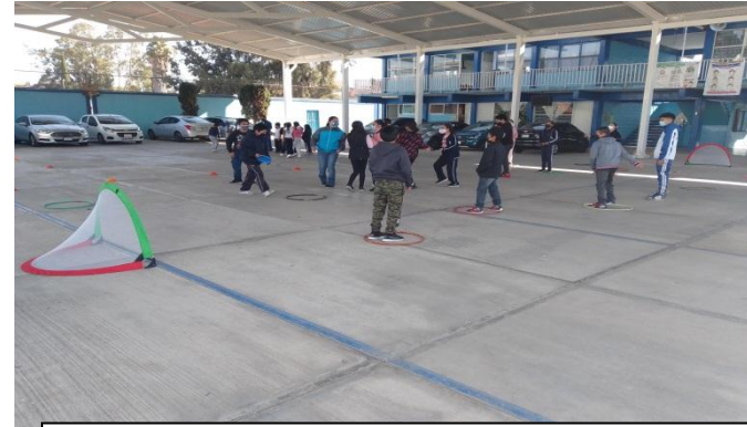
Alumnos de 6° juegos modificados Futbol frisbe, donde el objetivo es evitar que el frisbe entre en la portería sin que el alumno salga del aro

Los Juego modificado es un “juego global que recoge la esencia de uno o de toda una forma de juegos deportivos estándar, manteniendo la problemática de los juegos deportivos y exagerando los principios tácticos a su vez, reduciendo las exigencias o demandas técnicas de los grandes juegos deportivos” (Thorpe, Bunker y Almond 1986, en Devís 1996: 48-49).